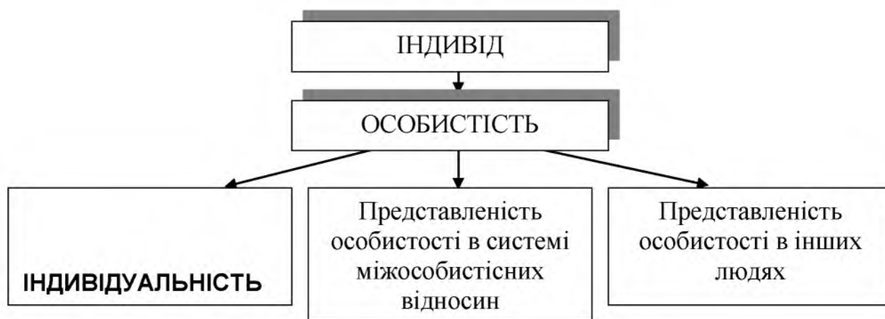
Рис. 2. Структура особистості в системі міжособистісних відносин

Індивідуальність (від лат. individuum – неподільне) – рівень розвитку людської особистості, що виражається в неповторності її психічних рис, продуктів діяльності. Ця неповторність впливає із сукупності відношень людини до світу, до природи, суспільства, інших людей і залежить від позиції споглядання, характеру діяльності та рівня її оригінальності. Індивідуальність передбачає усвідомлення індивідом належності до певної суспільної групи, класу тощо і на цій основі є виявом принципу індивідуалізації. Потяг до оригінальності є потягом до поглибленої і розширеної суспільної комунікації людини [4, с. 142–144].