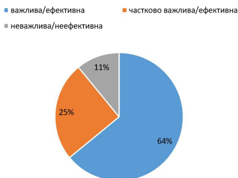
Рис. 2. Результати опитування студентів про важливість використання педагогіки партнерства та її вплив на ефективність освітнього процесу

Запитання другого блоку дали змогу з'ясувати думку студентів про важливість використання педагогіки партнерства та її вплив на ефективність освітнього процесу. Результати засвідчили (див. рис. 2): більшість (64%) респондентів вважає, що використання педагогіки партнерства є важливим та ефективним в освітньому процесі початкової школи.