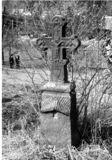
2. Надмогильний кам'яний хрест в с. Микуличин Івано-Франківської області. Перша половина XX ст.

Декоративне підсилення за допомогою кольору не практикується у зображенні іншої категорії розет, що виконувалися у так званій плоскорельєфній різьбі з вибраним фоном, виразність яких досягається за допомогою техніки різьблення. Спочатку на поверхню наноситься малюнок пелюсток, обведених