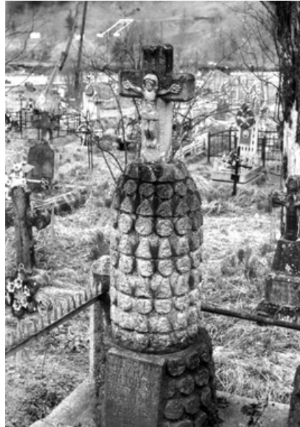
3. Надмогильний кам'яний хрест в с. Ямна Івано-Франківської обл. Перша половина XX ст.

На пам'ятниках поширені й інші іконографічні варіанти використання рослинних форм. На надгробку у с. Ворохта вінок, що обрамляє Розп'яття, змодельовано стримано [9]. На його валикоподібній формі плетиво імітують лаконічні врізи. Таке відносно спрощене різьблення вінка, що пластично не переобтяжує середхрестя, гармонійно поєднується з виразніше трактованими раменами, де профільовані пелюсткоподібні виступи виконані не тільки традиційно на їх завершеннях, але й біля середхрестя на місці з'єднання чотирьох кінців хреста, специфічно переходячи в