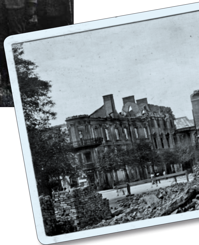
Руїни центральної частини м. Станіслава. 1917 р. Поштівка

через реквізиції, так як це сталося з міською бойнею на вул. Голуховського, яка через реквізицію машинних ременів не діяла. Були ще дані про мукомельний млин, ковбасну фабрику, міський газовий завод, фабрику паркетних підлог, 7 взуттєвих майстерень, 7 аптек, 171 торговий заклад. У місті були готелі: "Габсбург" (20 номерів), "Уніон" (34 номери), "Гібнер" (20 номерів), "Австрія" (18 номерів), "Центральний" (18 номерів), "Європейський" (16 номерів), "Чорний орел" (12 номерів). На вулицях працювало десять перевізників. Ціна на проїзд фіакром коливалася від 1 корони 20 грош до 4 корон залежно від комфортності та тривалості поїздки. Значною мірою була розвинута