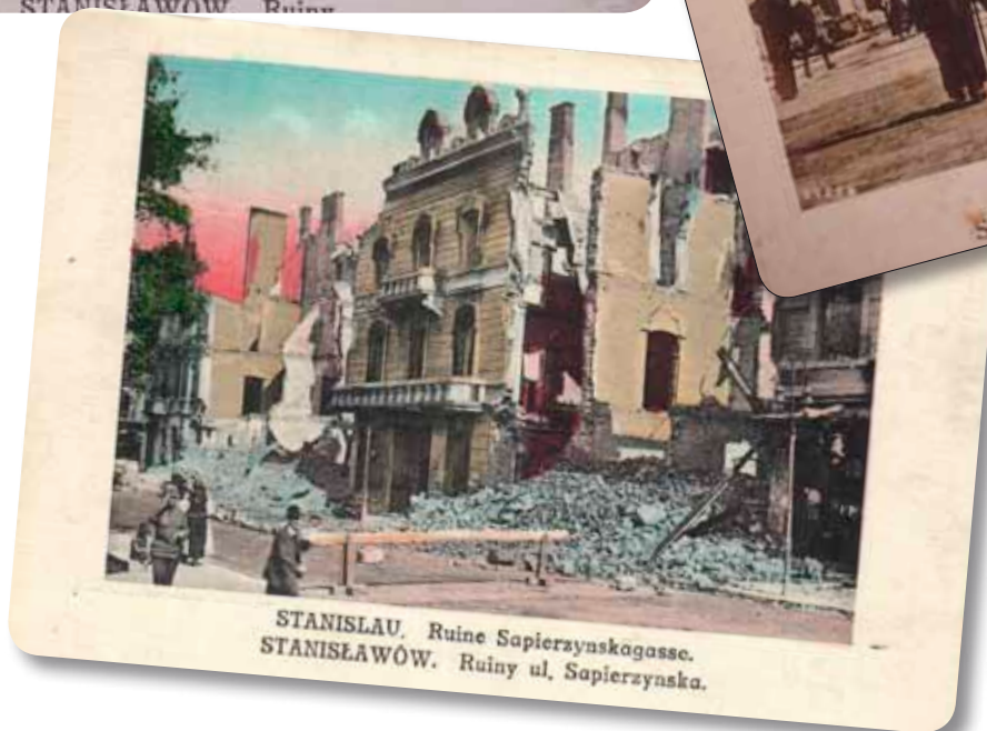
Руїни центральної частини м. Станиславова. 1917 р. Поштівка