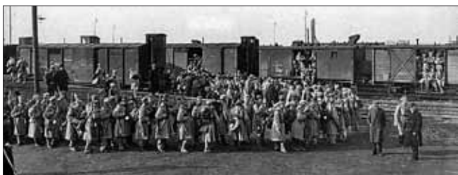
Польський легіон австро-угорської вирушає на фронт