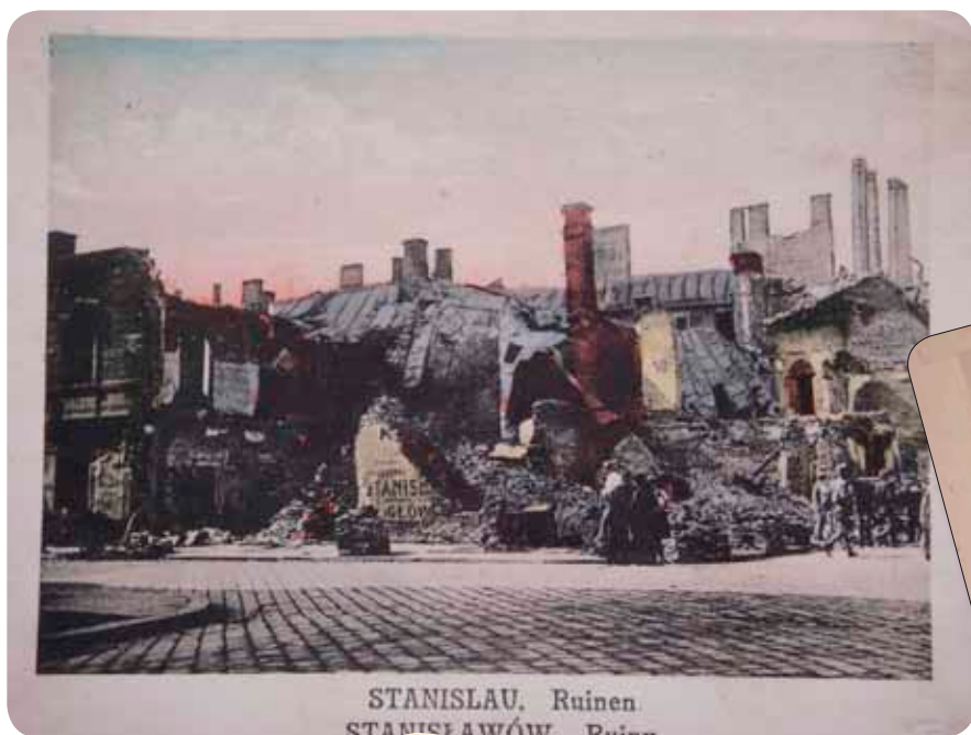
Руїни м. Станиславова. 1917 р. Поштівка