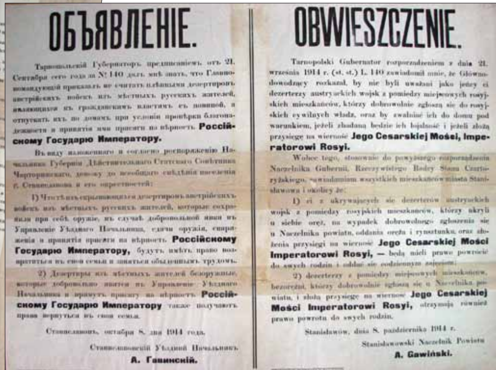
Оголошення станиславівського повітового начальника Гавинського, у якій повідомляється про обов'язковість здійснення богослужінь у місцевих церквах на честь російського царя Миколи II. м. Станиславів. Жовтень 1914 р.