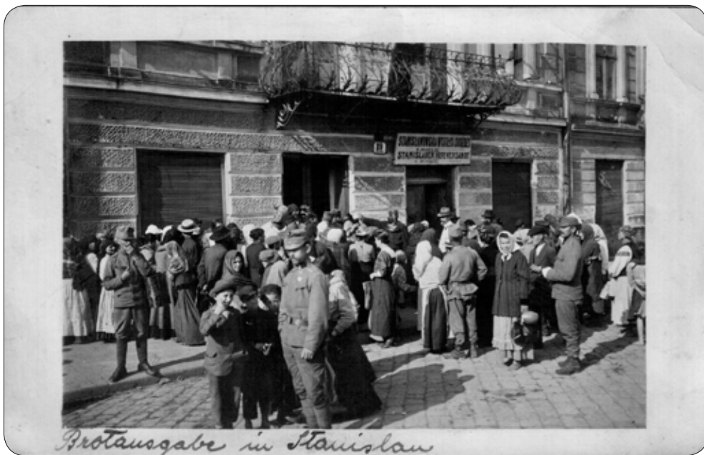
Роздача хлібопродуктів потребуючим жителям м. Станислава військовою адміністрацією австрійської влади. 1917 р.