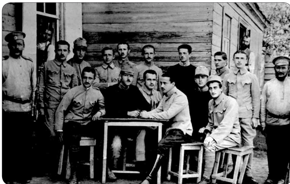
Українські Січові Стрільці в полоні

Муку житню (80 кг) 1 сорту можна було придбати за 30 рублів, муку пшеничну – за 36 рублів. Ціни на телячє і свинячє м'ясо сягали 1 рубля за 1 кг, масло коштувало 4 рублі за 1 кг, яйце продавалося по ціні 60 коп. за 1 штуку, а 1 літр молока можна було придбати за 35 коп.