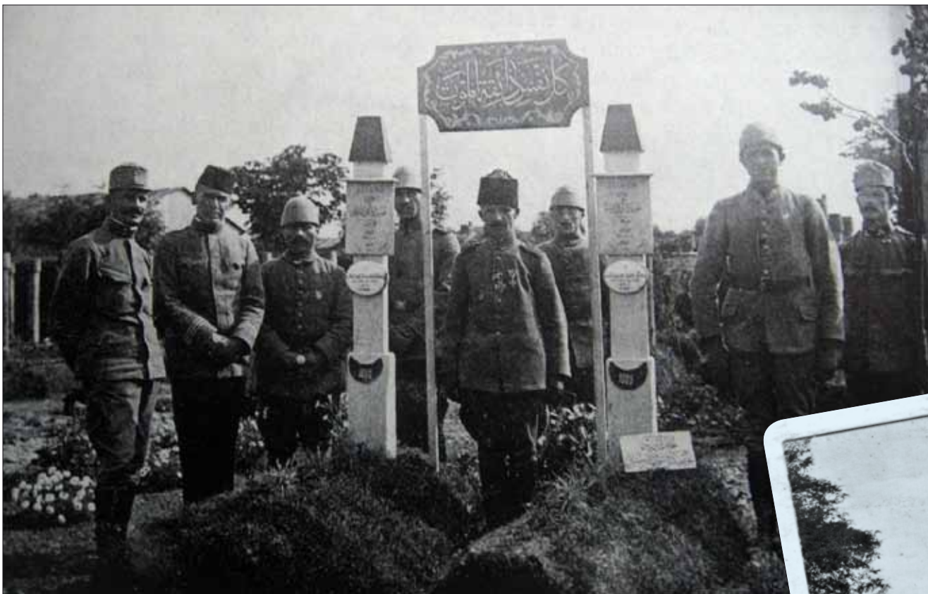
Турецькі й австрійські воїни біля могил полеглих турків на станіславівському цвинтарі у роки Першої світової війни