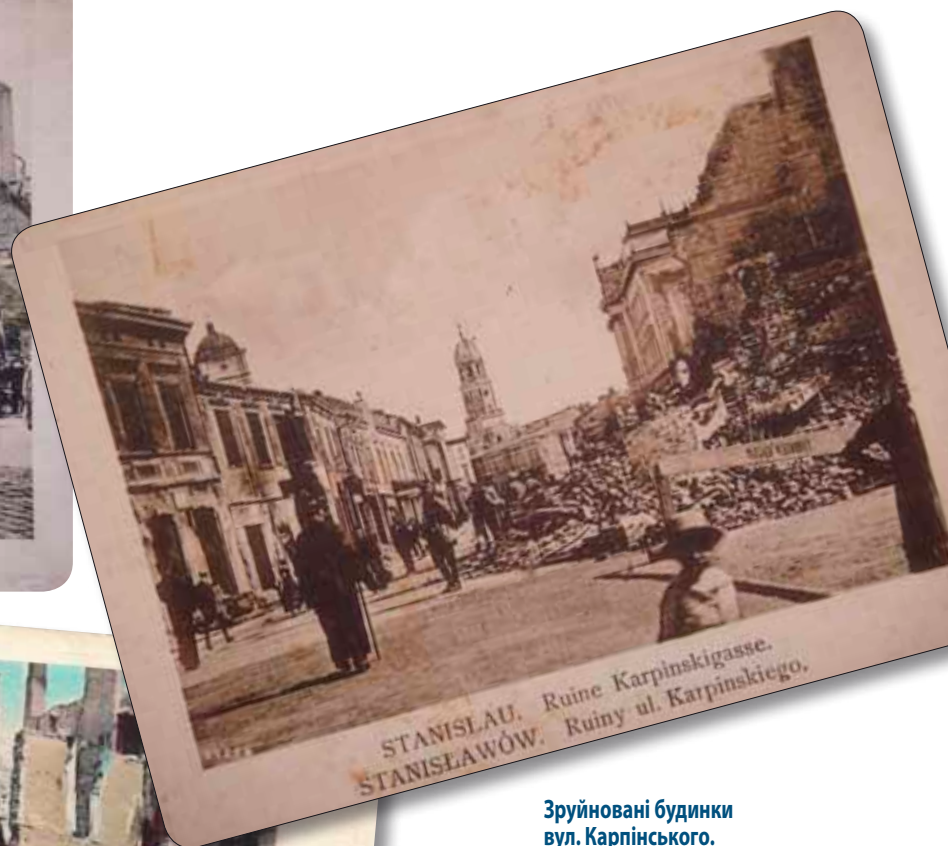
Зруйновані будинки по вул. Карпінського, м. Станиславів. 1917 р. Поштівка