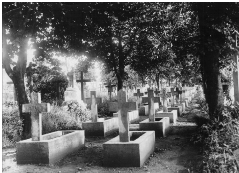
Могили Українських Січових Стрільців. м. Станіславів. 1930-і рр.

побажання, щоб Східна Галичина була "прилучена до матері – України". Підсумовуючи, зазначимо, що мешканці міста Станіслава повною мірою відчували на собі всі лихоліття і труднощі періоду Першої світової війни. Усіх міщан торкнулася глибока соціально-економічна криза, епідемічні хвороби і жаливе зниження життєвого рівня, яке супроводжує будь-яку війну. Значних пошкоджень через воєнні дії зазнали історико-архітектурні пам'ятки. Австрійська влада, незважаючи на патріотизм більшості населення міста, відшуквала і репресувала москвофілів. Натомість російська окупаційна адміністрація боролася з австрійськими шпигунами,