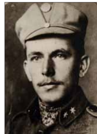
Олексій Колодій – український січовий стрілець, пізніше член Комуністичної партії Західної України. Уродженець м. Станиславів. Фото 1917 р.