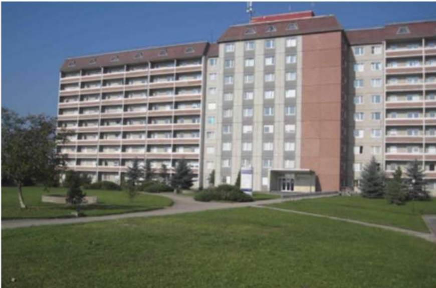
Корпус Обласної клінічної лікарні, в якому розміщене оториноларингологічне відділення