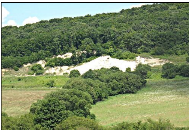
Фот. 3. Ареалы лесов на территории Предкарпаття (фот.: Н. Белова, 2014) Fot. 3. Obszary leśne na obszarze Podkarpacia (fot. N. Bielowa, 2014) Photo 3. Forest areas in the territory o Precarpathians (phot. by N. Belova, 2014)

погенной преобразованности. Для количественного расчета этого показателя избрана методика П. Г. ШИЩЕНКА (1988), согласно которой можно определить всю полноту антропогенного давления на составные компоненты агроландшафтов региона. Коэффициент антропогенного превращения определяется за следующей формулой: