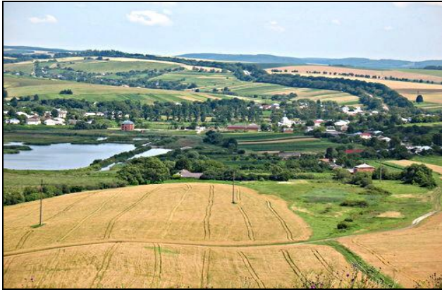
Фот. 1. Структура сельскохозяйственных угодий Предкарпаття Fot. 1. Struktura gruntów rolnych Podkarpacia Photo 1. The structure of agricultural lands of Precarpathians