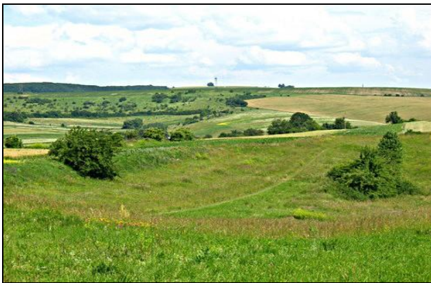
Фот. 2. Типичные дуга Предкарпаття (фот.: Н. Белова, 2014) Fot. 2. Turpowe łąki Podkarpacia (fot. N. Bielowa, 2014) Photo 2. Typical meadows of Precarpathians (phot. by N. Belova, 2014)