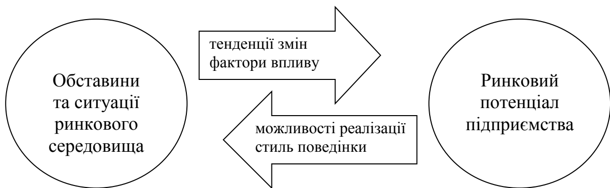
Рис. 3. Вплив зовнішнього середовища на формування ринкового потенціалу підприємства

Встановлено, що оцінка ринкового потенціалу підприємства має свої особливості. Ринковий потенціал підприємства та система аналітичних показників, які його характеризують, визначаються сукупністю обставин, що існують на ринку, та потенційними можливостями, які є доступними для підприємства (рис. 3).