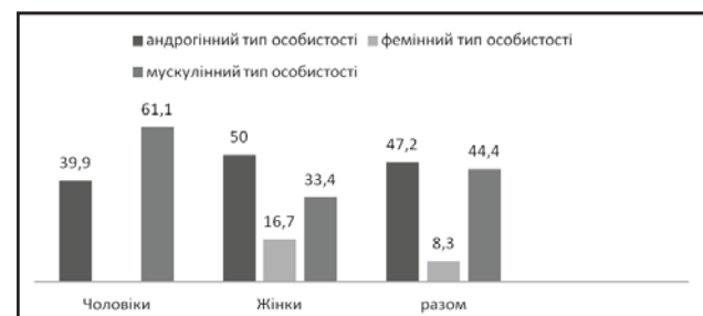
Рис.2. Гендерні особливості опитуваних (маскулістичний, феміністичний, андрогінний типи особистості)