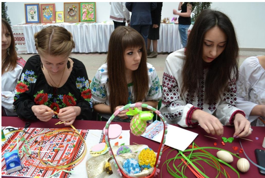
Благодійний етно-ярмарок на підтримку військових, які постраждали в зоні АТО «Ситий вареник» (31 березня 2015)