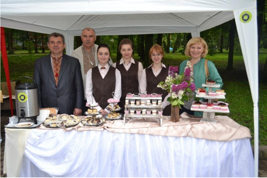
Благодійна акція – «Вареники в АТО», «Медівнички В АТО»