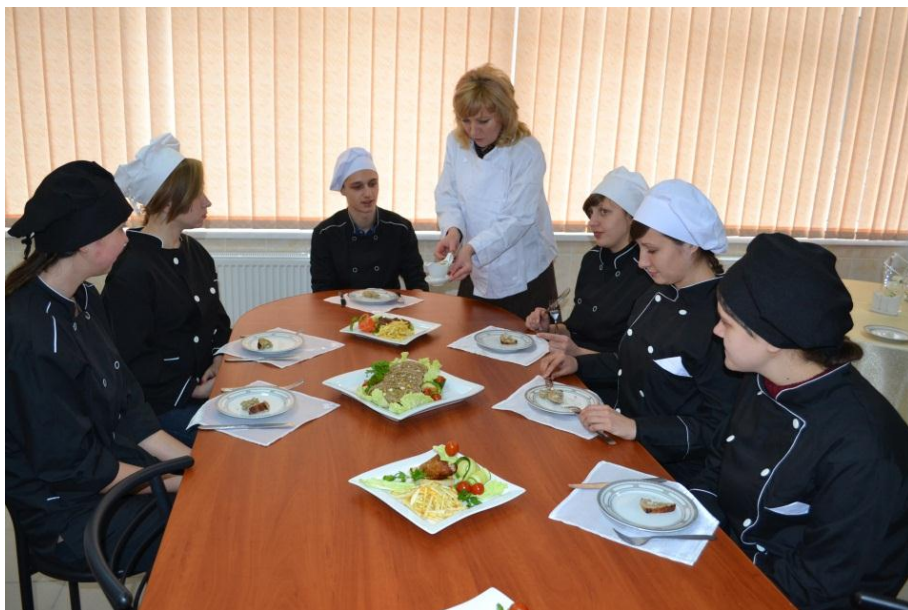
Барбекю-фест «Пузатий їжак» (25 вересня 2015)