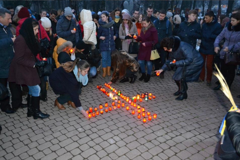
Перегляд кінострічок в рамках Днів польського кіно (щорічно, листопад)

Фестиваль-конкурс студентської мистецької творчості «Весняна хвиля» (щорічно, квітень)