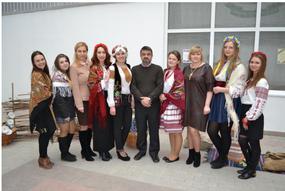
Майстер-класи з кулінарної майстерності (24 вересня 2015)