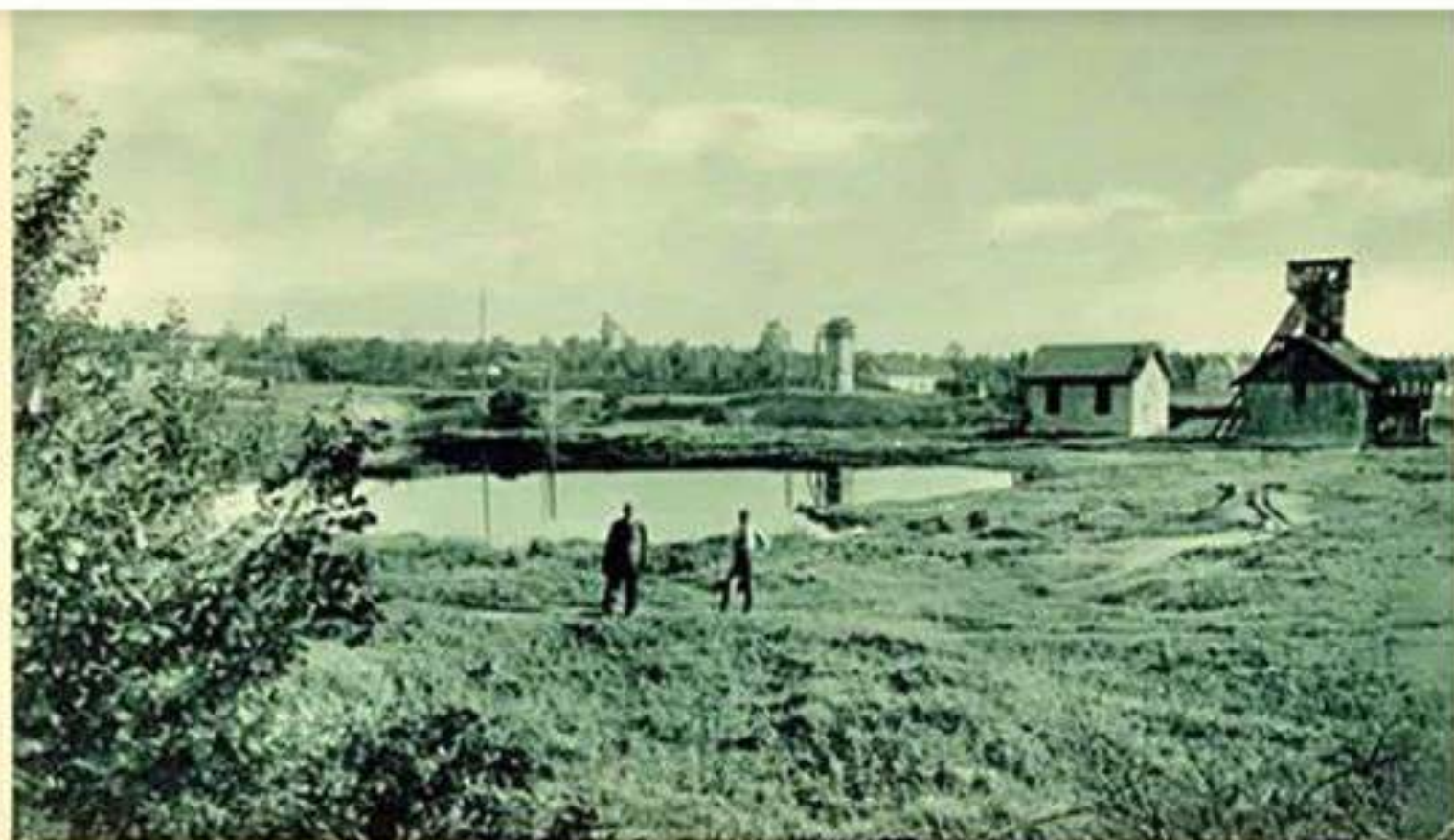
ПОТУРКИ. Копальня воску.