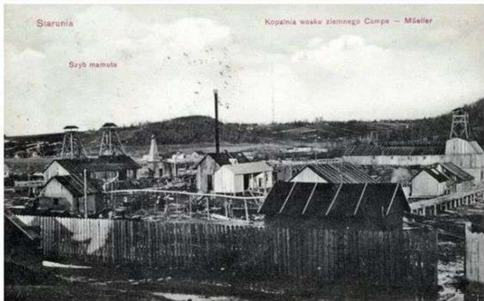
Копальня озокериту біля Старуні. Поштівка 1908 року