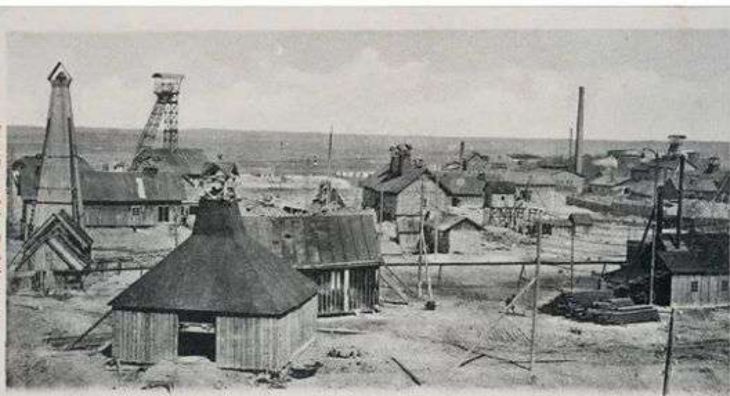
Акcyjne towarzystwo dla wosku i oleju ziemnego i galicyjski bank kredytowy w Borislawiu.

Німець Кароль Філіп Функе у монографії «Naturgeschichte und Technologie» (Відень, 1817 р.) описав родовища нафти та згадав про видобуток земного воску поблизу Дрогобича та його використання для виготовлення місцевим населенням свічок. Професор геології Єжи Боґуміл Пуш, який у 1817–1830 рр. здійснив геологічні дослідження Польщі, у вересні 1828 р. на З'їзді німецьких природознавців і лікарів у Берліні доповідав, що північно-східні схили Польських Карпат багаті різними мінералами, зокрема й скельною олією й бітумами. У монографії «Geognostische Beschreibung von Polen sowie der übrigen Nordkarpathen-Länder» (Штутгарт, 1836 р.) ним згадано родовища озокериту у Бориславі, Попелях та Трускавці; вказано, що він зустрічається у вигляді тонких шарів між сланцями та пісковиками і є продуктом окислення рідкої скельної олії. У 1827 р. офіційний дозвіл на побудову в Трускавці стаціонарного будинку для приймання ванн і чотирьох будинків для проживання відпочиваючих одержав адміністратор державних маєтків Юзеф Міцевскі.