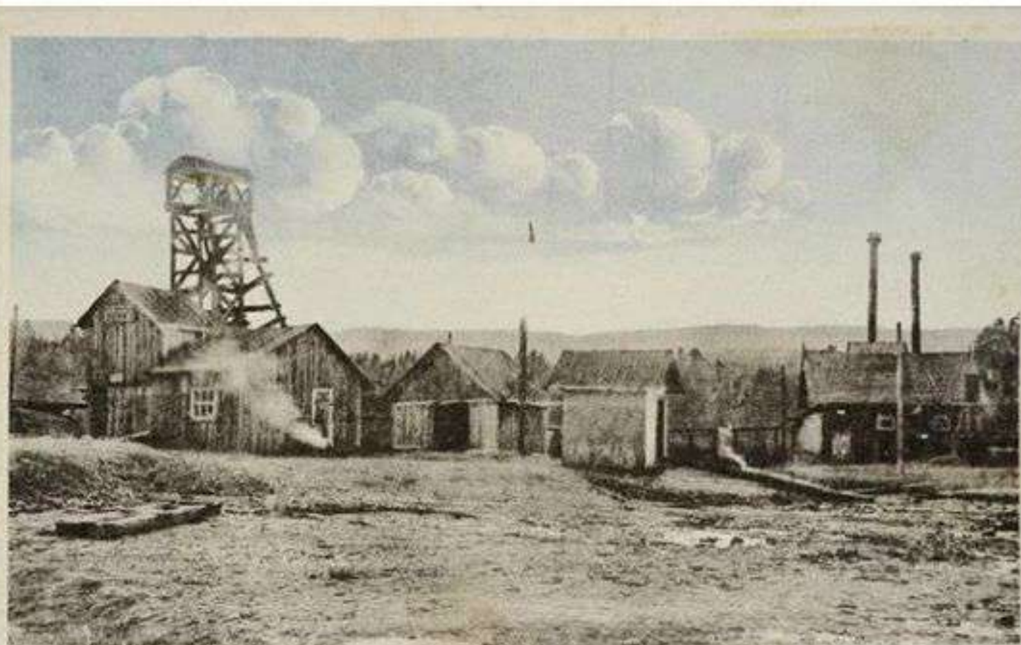
POMORZANY obok Truskawca. Szyb „Katarzyna”, kopalnia wosku.

Розпочалися дебати у державних органах влади. 16 листопада 1860 р. розпорядженням Міністерства фінансів озокерит знову було віднесено до державної монополії, а Галицький сейм 25 квітня 1861 р. прийняв свою ухвалу, згідно з якою нафта і подібні мінерали не повинні підпадати під Гірничий устав, однак мають видобуватися з «позитивом» для місцевого населення та природи. Саме цей різнобіг думок зумовив підписання цісарської постанови від 22 січня 1862 р., яка постановляла, що відтоді земний віск і земна олія не повинні підпадати під Гірничий устав, однак повинні використовуватися лише для засобів освітлення. Таким чином, було фактично призупинено промисловий розвиток цієї галузі господарювання на невизначений термін. 30 травня 1865 р. Міністерство торгівлі видало розпорядження, що відміняло попередні регуляторні акти і вивело озокерит з-під заборони експлуатації Гірничого уставу.