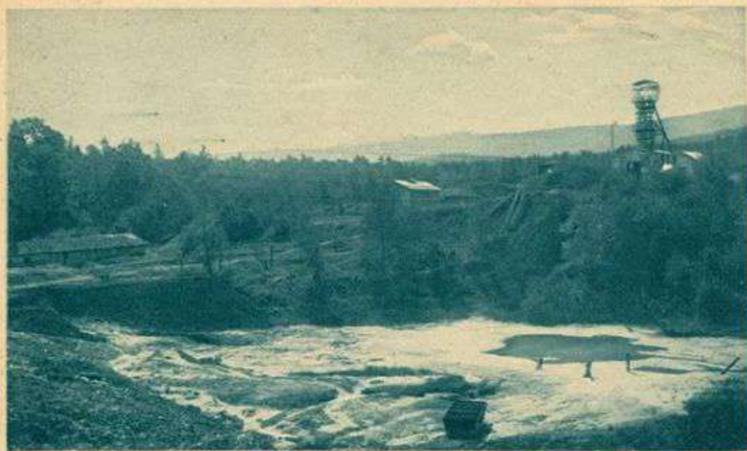
TRUSKAWIEC-ZDRÓJ. Kopalnia wosku.

Однак, розробка нафти й озокериту у більших масштабах велася нелегально селянами та єврейськими підприємцями і торгашами за дозволом власників землі. Цей процес видобування заключався у відборі корисних копалин з неглибоких ям (копанок) примітивними способами та засобами.