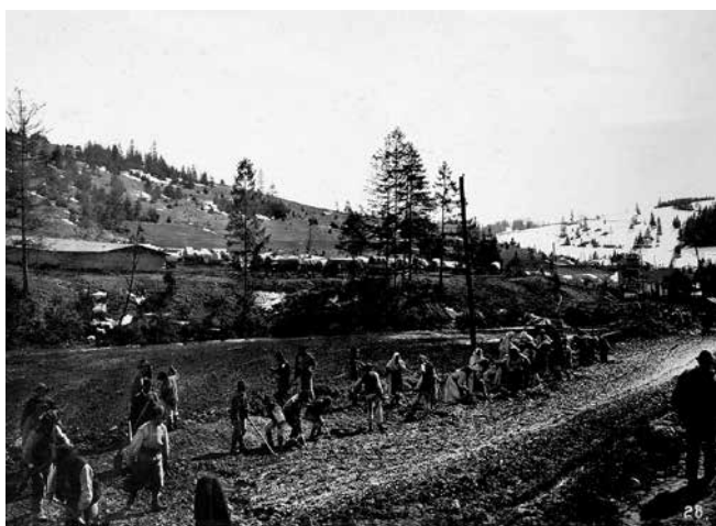
Ремонт дороги в с. Опорець