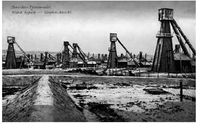
Видобуток нафти біля м. Борислав. 1914 р.