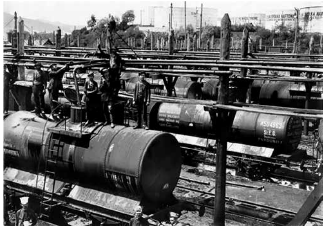
Завантаження цистерн нафтою в м. Борислав. 1910 р.

латифундій при цьому користувалися значними податковими пільгами. За 1 га землі вони платили в середньому по 1,24 крони податку, селяни – аж по 2,08 крони. Магнати, які володіли наділами понад 5 тис. га землі, платили ще менше – 0,86 крони за 1 га.