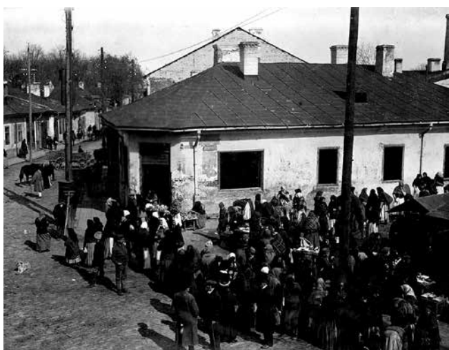
Ринок у м. Броди

Перетворення ЗУЗ на аграрно-сировинний придаток Австро-Угорщини, їх деградація і відставання у розвитку від ін. провінцій імперії стали очевидними напередодні ПСВ. Так, 1902 в Галичині налічувалося понад 650 тис. г-в. Вони володіли лише 156 тис. соломорізок, 21,4 тис. машин для очищення і сортування зерна, 6,6 тис. молотарок, 1562 сівалками, 532 косарками. У їхньому користуванні перебували також сепаратори, зернодробарки, преси, луцильніки. 1910 Галичина дала 37 % усієї пшениці Австрії, 32 % вівса, 27 % жита, по 22 % ячменю і кукурудзи. В краї зосереджувалося майже 50 % усіх коней Ціслейтанії, 32 % корів, 27 % усієї великої рогатої худоби, 29 % свиней, 15 % овець. При цьому, за підрахунками І. Франка, на одного жителя Галичини в середньому припадало найменше серед європейців кілограмів зерна і м'яса, та найбільше – картоплі. Австр. статистика визнавала той факт, що щороку в провінції від недоїдання і голоду помирало бл. 50 тис. осіб. Загалом 1913 в краї нараховувалося (голів): 852 тис. коней, 1740 тис. великої рогатої худоби, 243 тис. овець, 1135,6 тис. свиней.