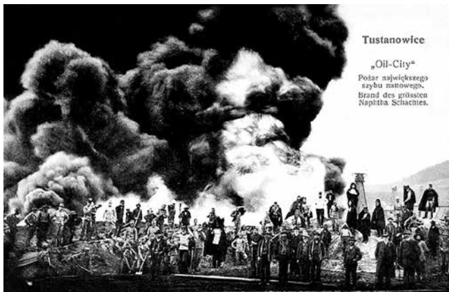
Пожежа на нафтовій свердловині в с. Тустановичі. 1908 р.