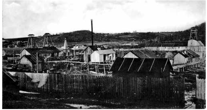
Копальня озокериту в с. Старуня у 1908 р.

Ситуація у великих поміщицьких г-вах також була складною. З понад 3600 поміщиків Сх. Галичини перед ПСВ понад 80 % заставили свої маєтки в банках. Вони були змушені парцелювати землю у фільварках і продавати. Чисельність фільварків 1889–1902 скоротилася з 4500 до 3117 Лише бл. 20 % дідичів могли собі дозволити закупівлю машин, залізних знарядь обробітку землі, нових сортів рослин та порід тварин, міндобрив тощо. Власники