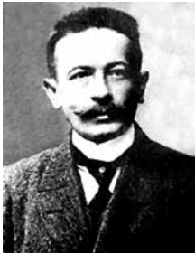
ЕЛЮК Сидір Теодорович

04.1931 – нач. штабу ЧА. 02.1934 – канд. у члени ЦК ВКП(б). 1935 – маршал СРСР. З 11.05.1937 – 1-й заст. наркома оборони СРСР (замінив на цьому посту М. Тухачевського). Ініціатор переозброєння ЧА та флоту СРСР, створення заг.-держ. с-ми ППО. Прихильник створення великих бронетанкових з'єднань.