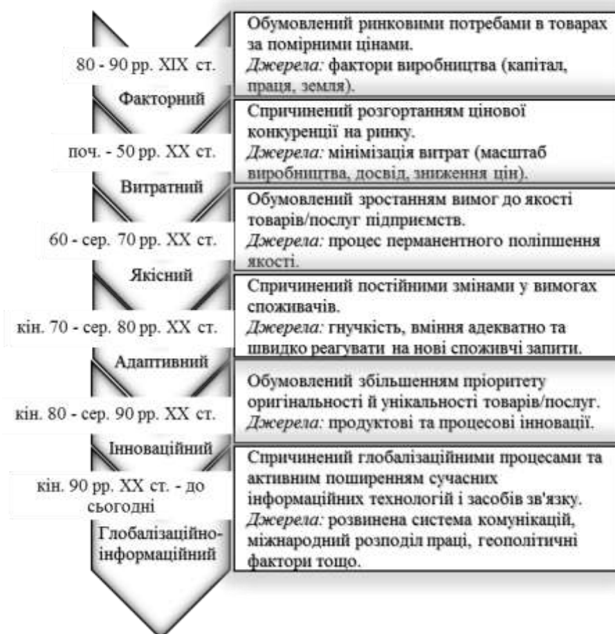
Рис. 2. Етапи джерел формування конкурентних переваг

Адже, як стверджує А. О. Сітковська «в умовах розвинених ринкових відносин конкуренція спонукає до пошуку нових, більш досконалих організаційних форм бізнесу, до розробки і впровадження досягнень науково-технічного прогресу» [5, с. 39]