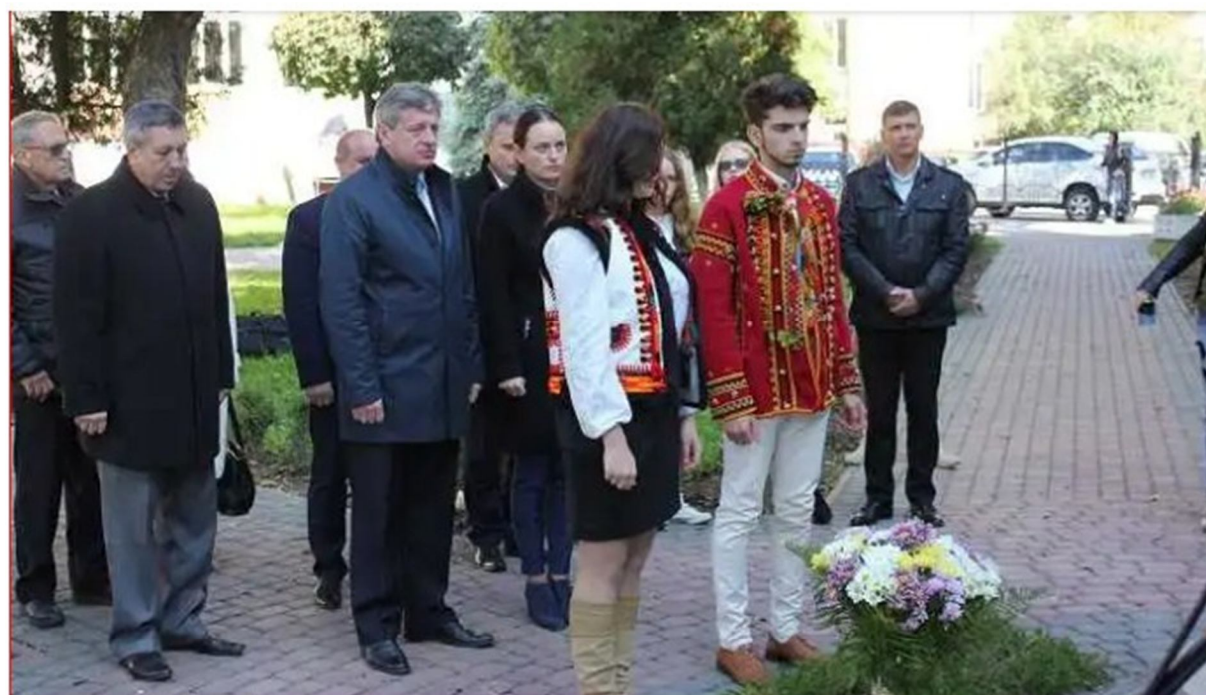
Студенти, викладачі та ректор Прикарпатського Національного Університету Ім.В.Стефаника Ігор Цепенда разом з батьками загиблого Героя Романа Гурика вшановують пам'ять Героїв «Небесної Сотні»