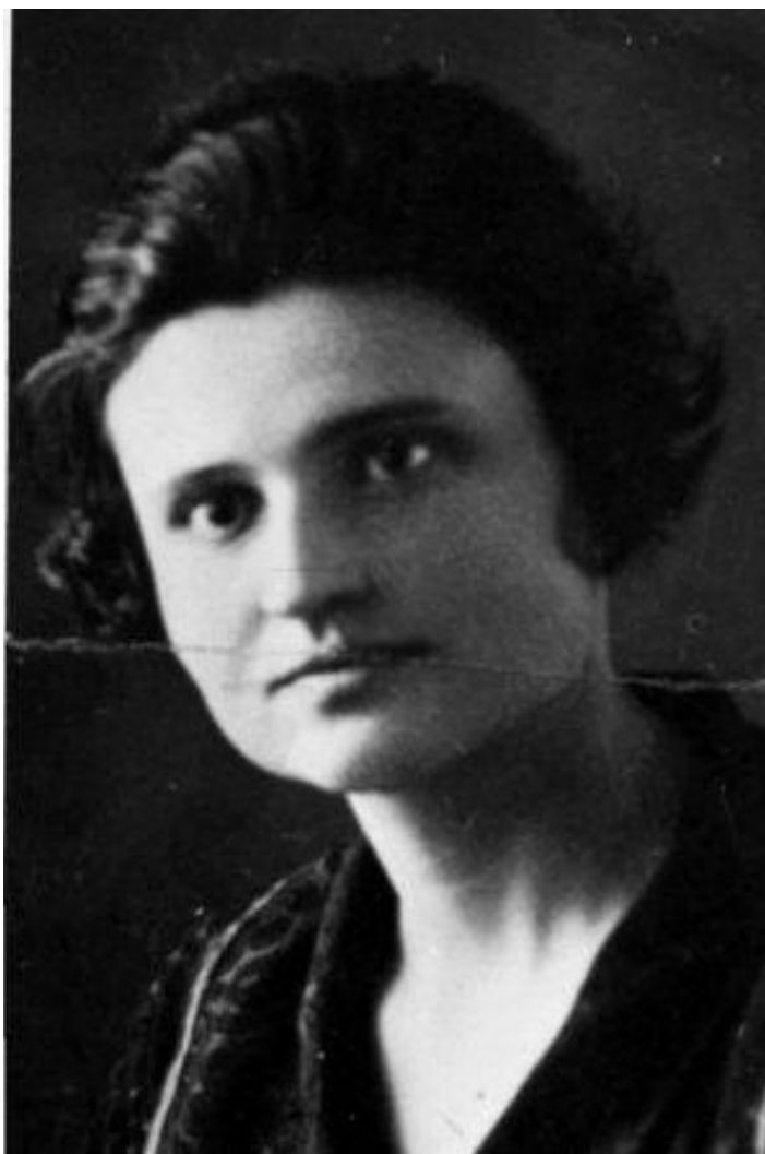
Оксана Мешко в молоді роки

Інтернет газета. URL: https://m.gazeta.ua/articles/history/_meni-navit-krasche-schob-ya-bula-zaareshtovana-110-rokiv-tomu-narodilasya-kozacka-matir-oksana-meshko/607072 (Дата звернення: 31.05.2024).