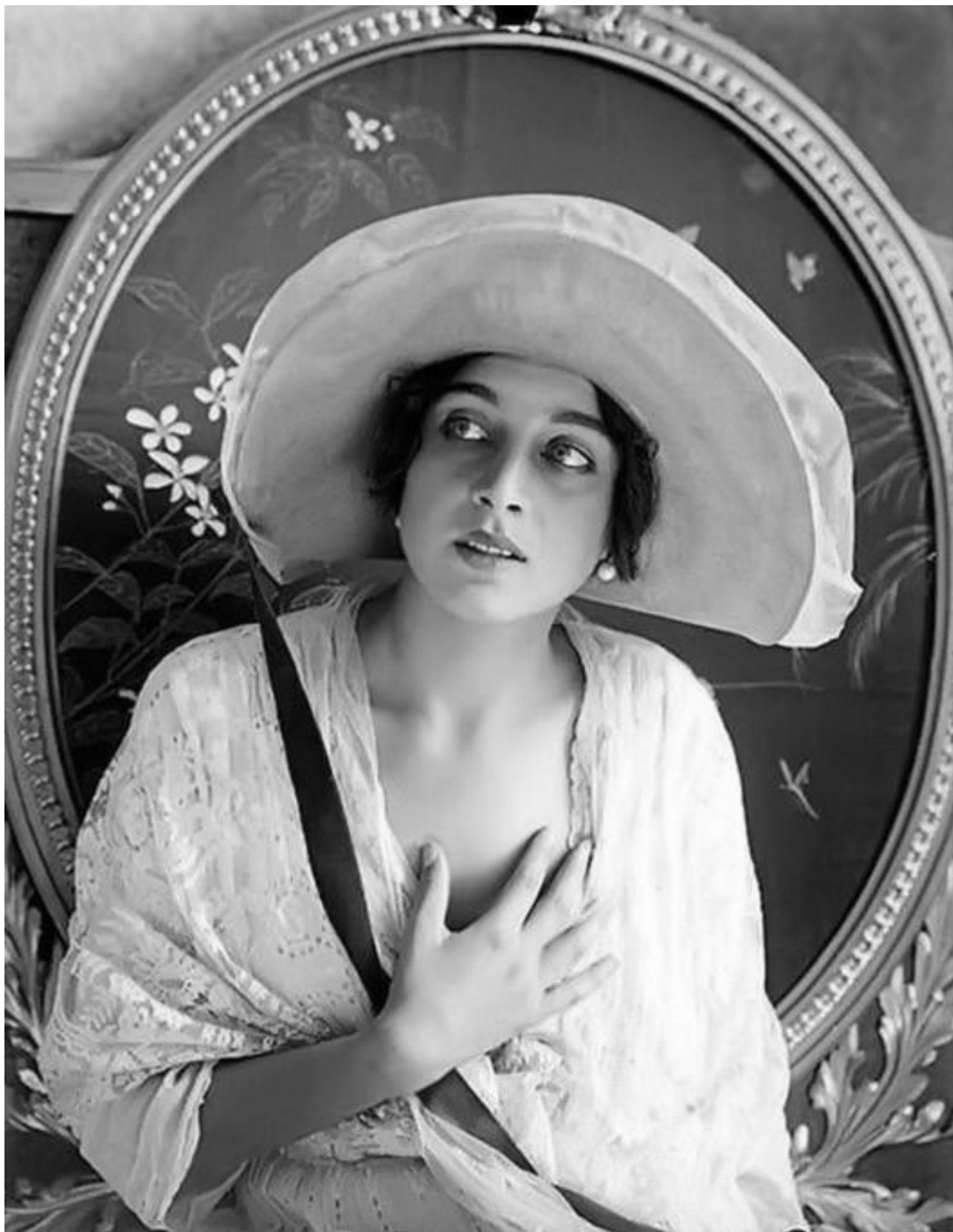
Найвідоміша актриса дореволюційного часу і епохи визвольних змагань Віра Холодна (1893-1919). URL: https://odnb.odessa.ua/view_post.php?id=2142