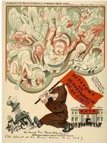
Журнал "Безбожник" (виходив з 1923 р.)