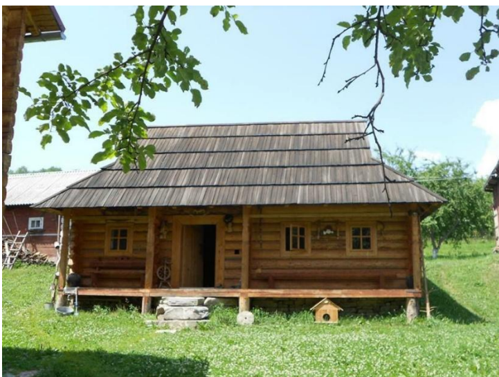
Музей Гната Хоткевича