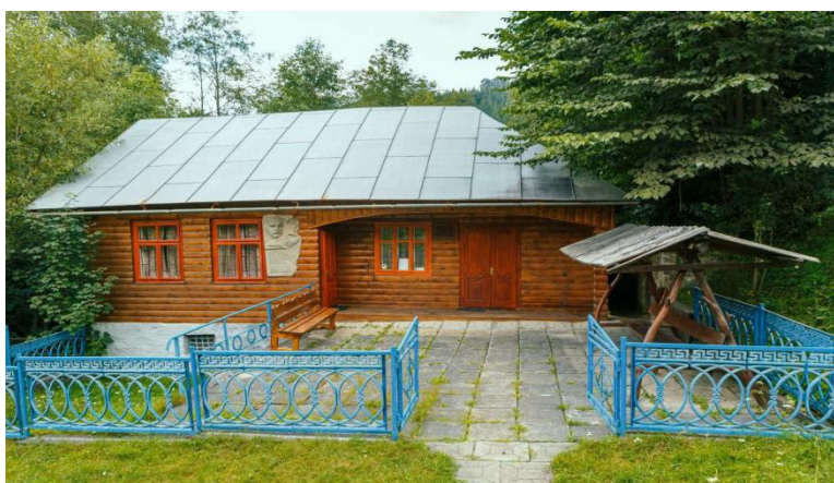
Галерія музею гуцульської традиції та обряду