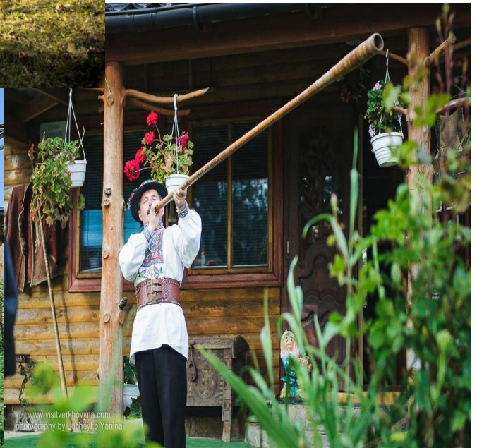
Музей Параски Плитки-Горицвіт