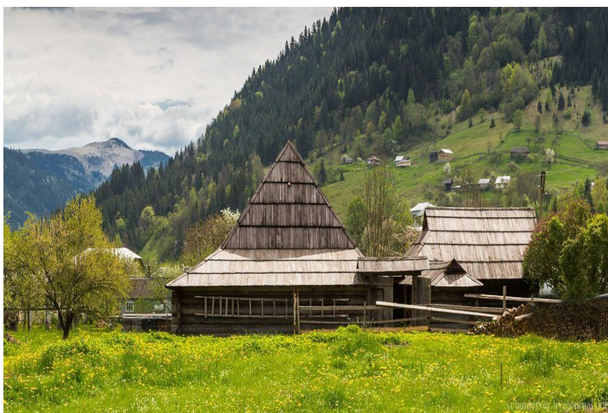
Музей Михайла Грушевського