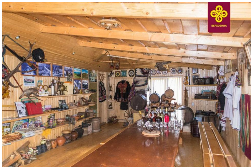
Музей Петра Шекрика- Доникового