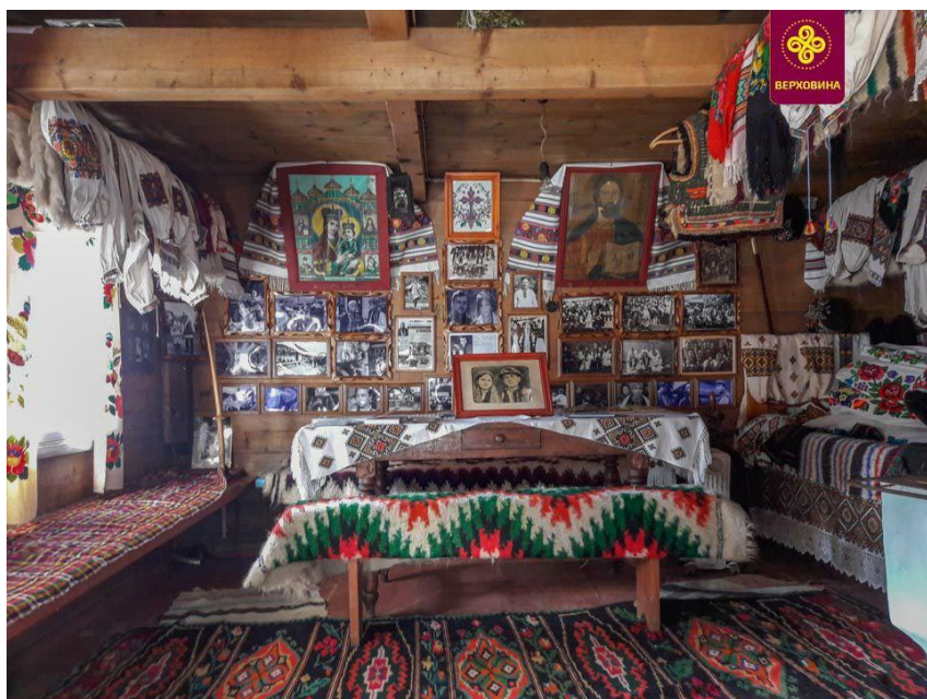
Музей прикладного мистецтва «Виноград»