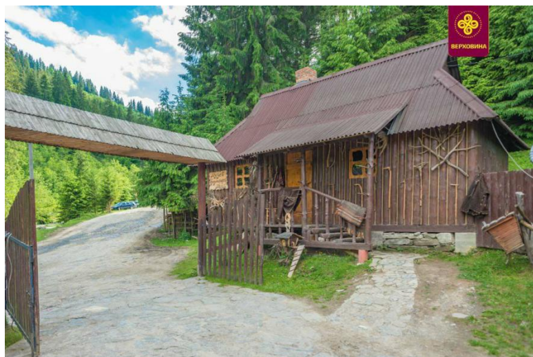
Верховинський музей «Вишиванки Галинки»