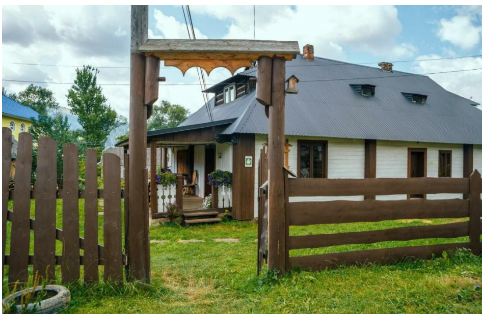
Музей «Анничка» хата гражда