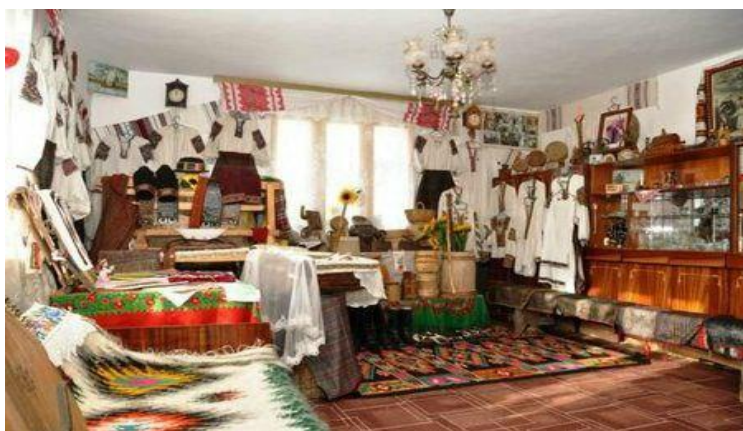
Музей гуцульської магії