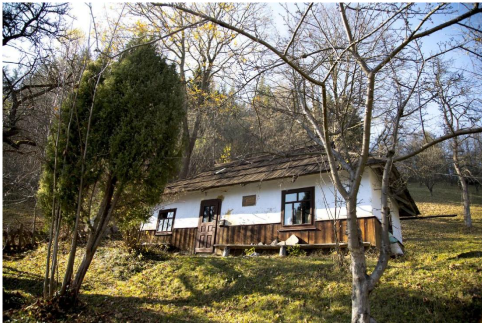
Музей Олекси Довбуша