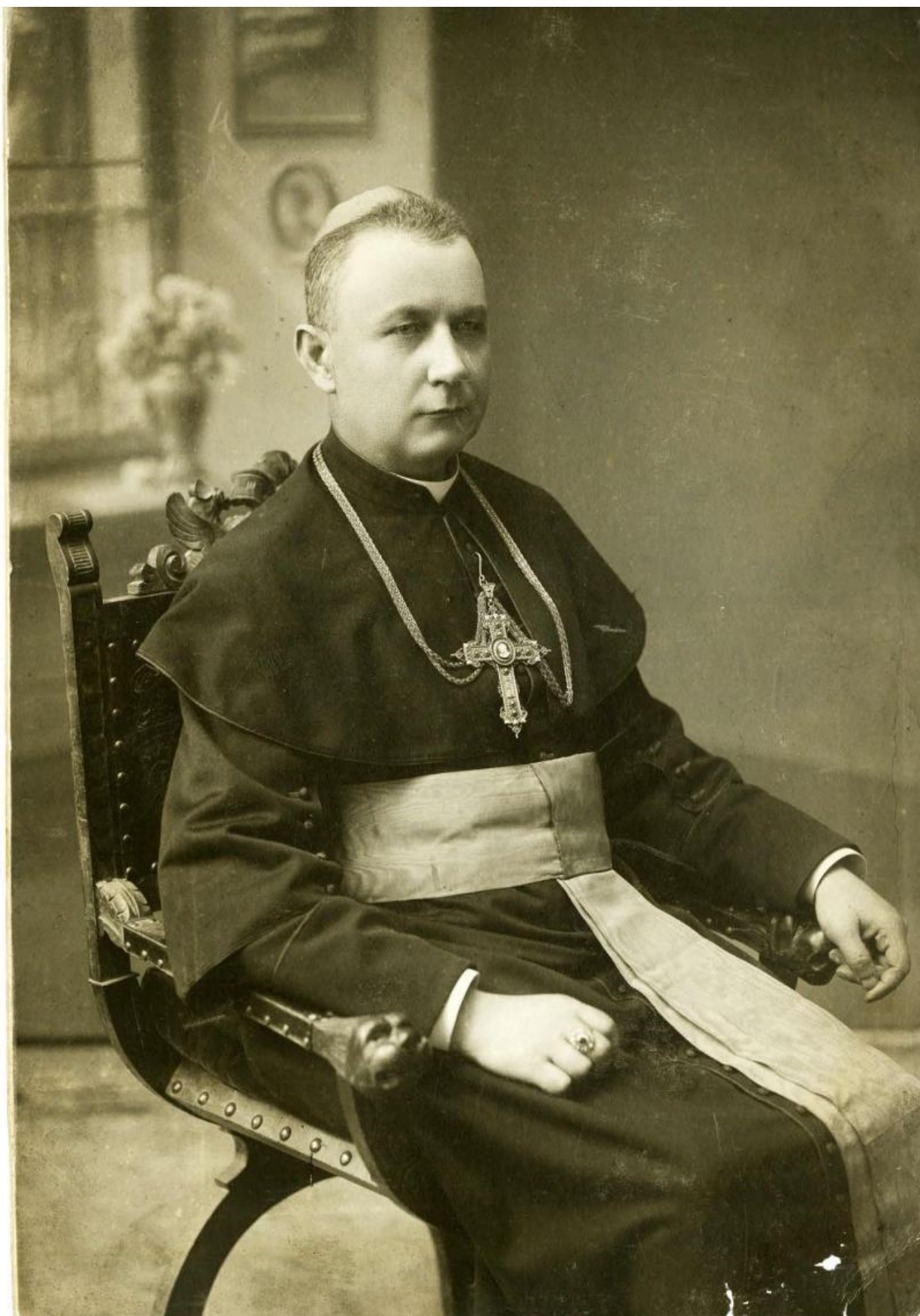
Рис. 1.1. Блаженніший Григорій Хомишин