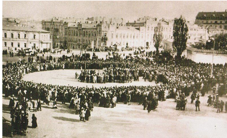
«Молитва на Софійському майдані»

Активну політику проводив гетьман Скоропадський на міжнародній арені. Створене міністерство закордонних справ очолив Д. Дорошенко – відомий історик.