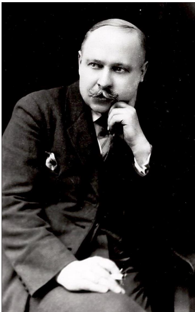
Олександр Кошиць. США. 1923 рік