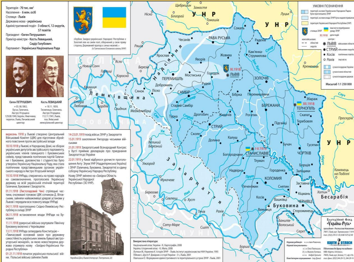
Мапа ЗУНР (2008), видана Благодійним фондом «Україна-Русь»