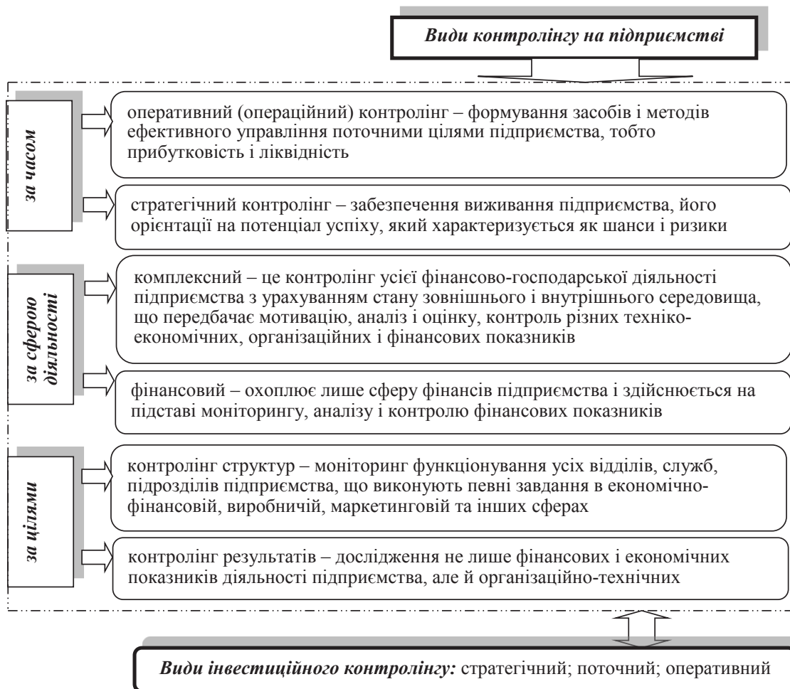
Рис. 1. Узагальнення видів контролінгу на підприємстві

Таким чином, слід відмітити, що наукові підходи до трактування сутності поняття «контролінг» дещо відрізняються, проте основоположними елементами даної категорії повинні бути: системне спостереження; аналізування; планування (бюджетування); прогнозування; контроль (моніторинг) як установлених показників, так