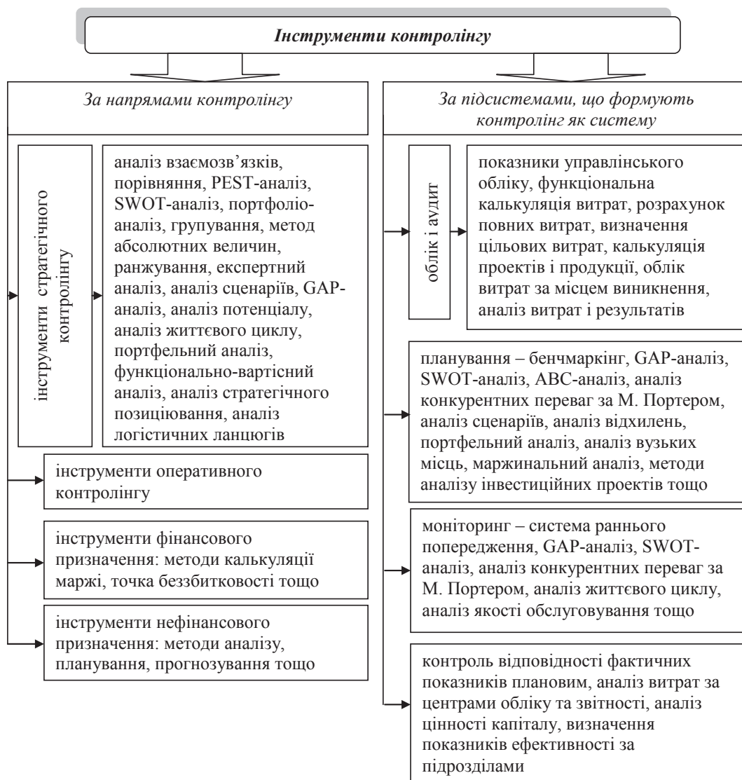
Рис. 2. Класифікація інструментів контролінгу