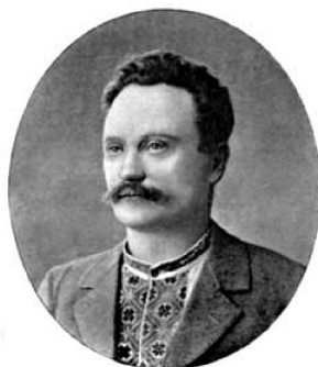
Др. Іван Франко.