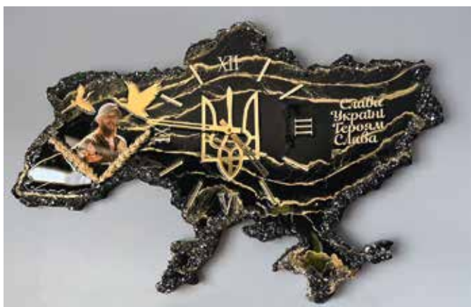
Друзі Олега зробили для його батька та тітки такі годинники