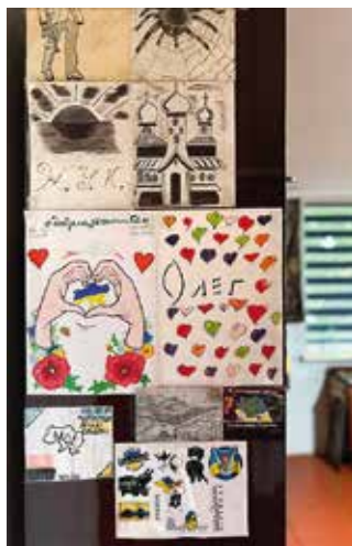
Музей у Олеговій кімнаті