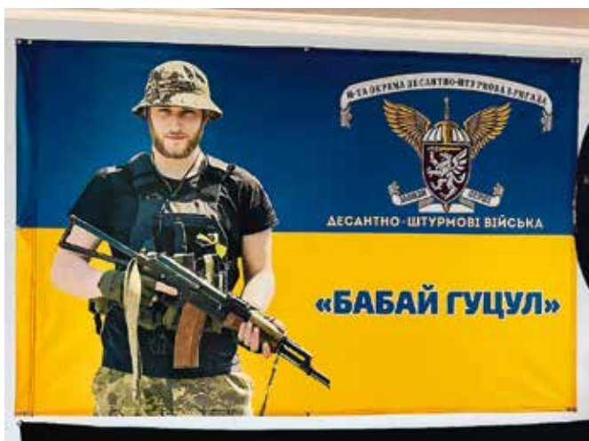
Музей у Олеговій кімнаті