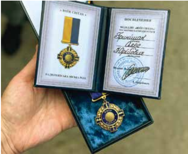
Медаль «Воїн світла» Надвірнянська міська рада вручає родинам військовослужбовців, які віддали життя за Україну