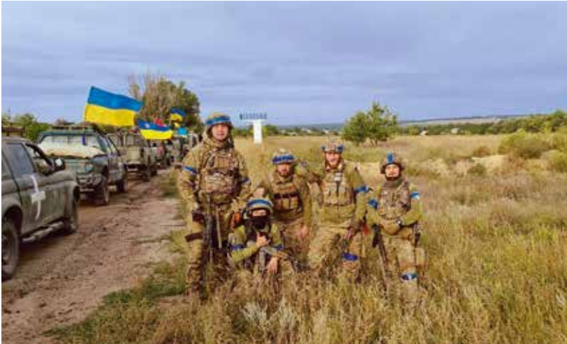
Ізюм, вересень 2022