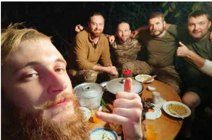
Вечеря з побратимами