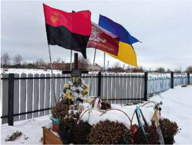
Могила Олега Гринішака в с. Назавізів