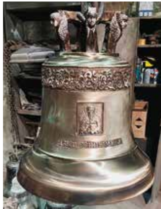
Дзвін Воїнів миру