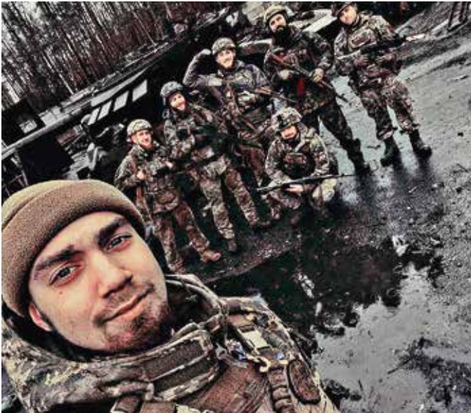
Протитанкісти 80 ОДШБ