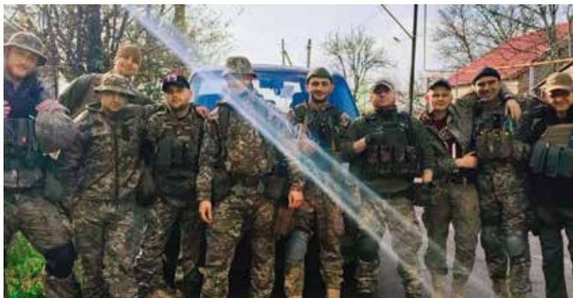
Червоний Тік. Воїни Світла. Середина квітня 2022 року