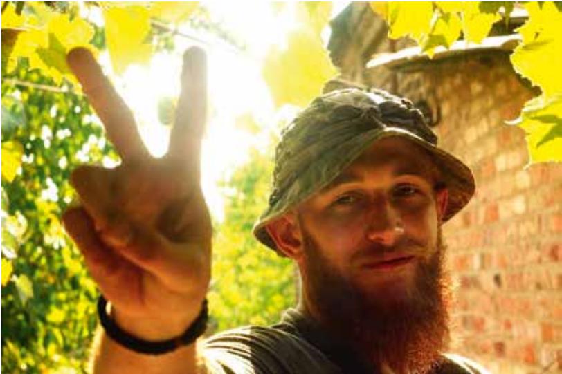
Разом до перемоги