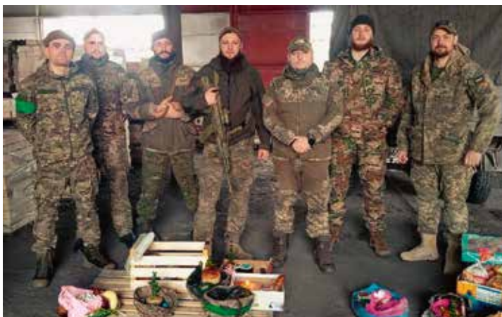
Великдень на Донбасі. Замість кошиків військові шоломи та коробки