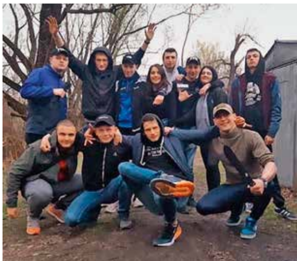
Друзі дитинства. Між собою називали себе «шпана», а гараж, де завжди збиралися – «барлога».