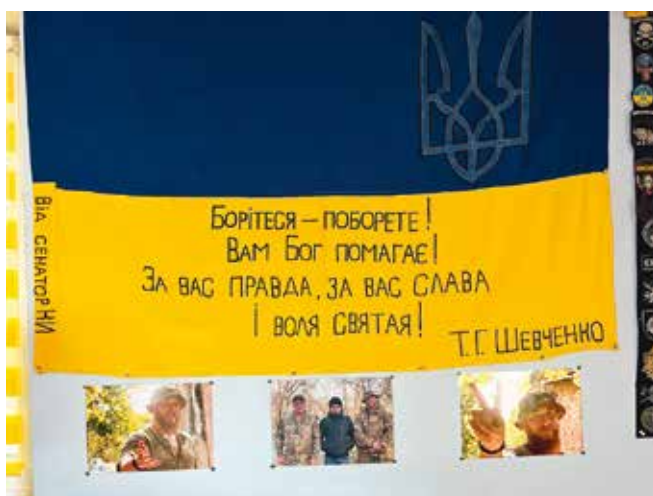
Музей у Олеговій кімнаті