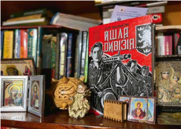
В Олеговій кімнаті багато книг та ікон