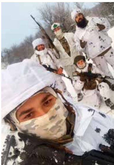
Маскування понад усе