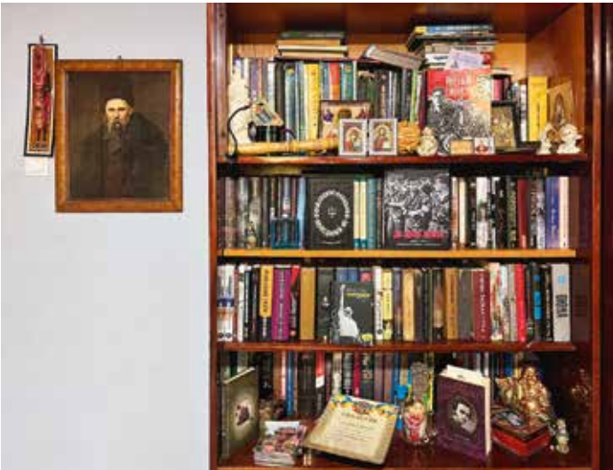
Книги в Олеговій кімнаті. Він сам був, як книга. Від нього можна було черпати і черпати