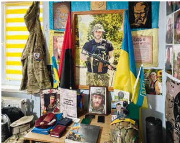
В Олеговій кімнаті батько зробив невеликий музей у пам'ять про сина