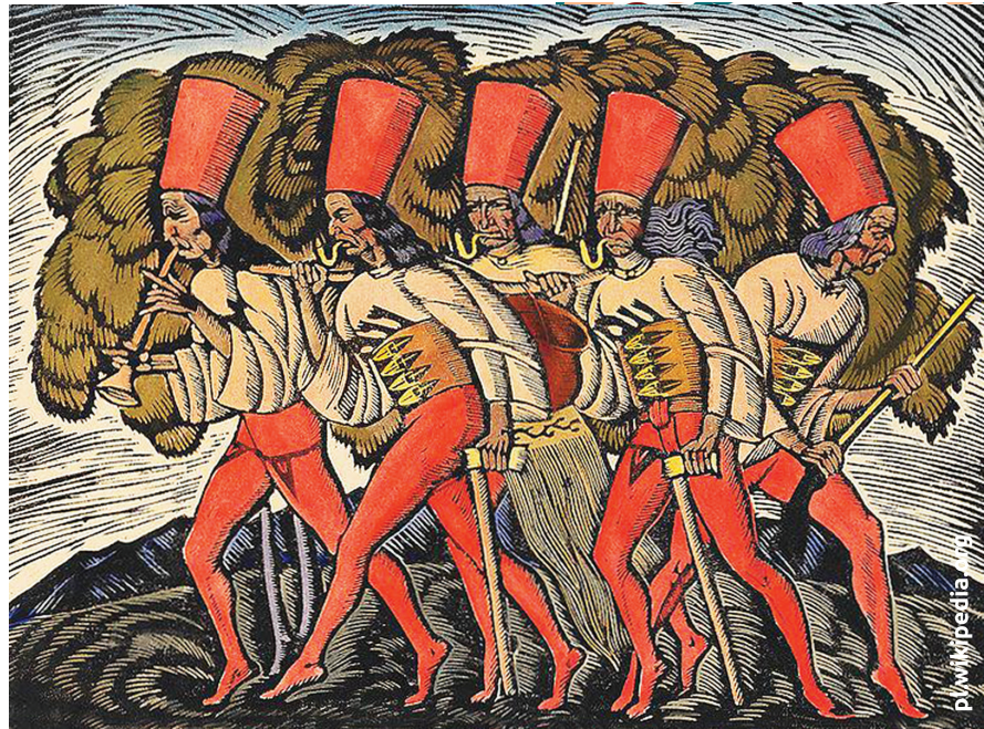
Марш розбійників. Дереворит Владислава Скочиляса, 1916 р.