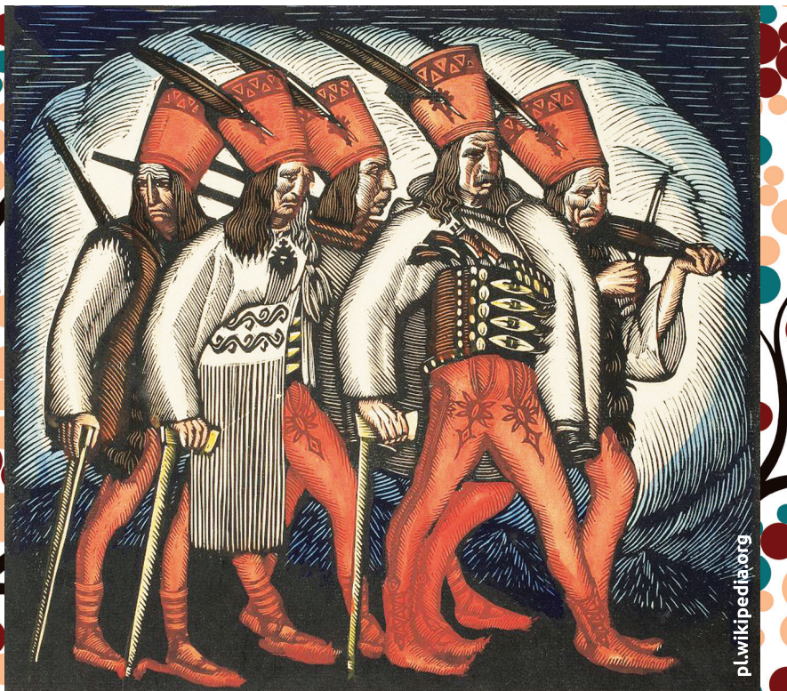
Марш розбійників. Дереворит Владислава Скочиляса, 1916 р.

За мить до смерті його запитали, чи хоче він висповідатися і причаститися, на що поранений опришок недвозначно відповів: «Уже я причащався і висповідався в той час, в котрий вступив на ту дорогу». З іншого боку, відомо про опришкові дари Великому Скитові в Маняві, а також про церковний дзвін у Нижньому Вербіжі.