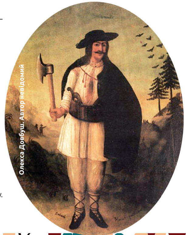
Олекса Довбуш. Автор невідомий

у Великодню суботу (sic!) того ж року після великої кількості випитого алкоголю. Не досить того, що брати між собою побилися на топірцях, і Олекса зазнав важкого поранення ноги, тоді ж вони вбили когось, хто, можливо, намагався їх розборонити.