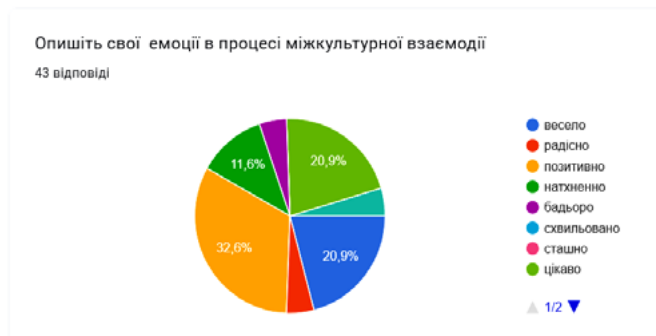
Рис. 1. Результати опитування студентів-учасників інтегрованого заняття міжкультурної взаємодії

Мовами спілкування на такому інтегрованому занятті були українська, англійська (як мова посередник) та рідна мова студентів-іноземців (іспанська, турецька, французька). Як стверджують дослідники, процес спілкування носіїв різних культур і мов, вимагає мови посередника. Такою мовою, зазвичай, є англійська. Зрештою, можна розглядати так звану триступеневу мовну парадигму комунікації: українська – англійська – рідна (французька, португальська, іспанська та ін.) [3, с. 92]. Практикуючи саме її, мети заняття було досягнуто, учасники активно взаємодіяли й отримали нові, позитивні емоції (Рис. 1).