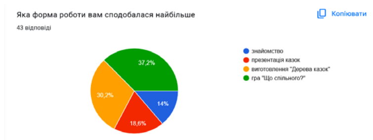
Рис. 2. Форми роботи, які сподобалися учасникам заняття

Для виконання інтерактивних завдань (гра “Що спільного?” та виготовлення “Дерева казок”) усіх учасників інтегрованого заняття було поділено на 3 великі групи, де в кожній групі були студенти різних