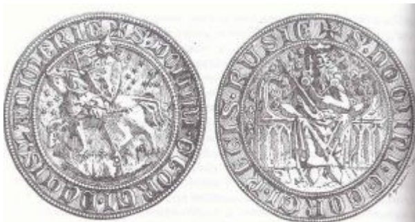
Зображення з печатки короля Русі Юрія I

Так чи інакше, на мапі Європи постало королівство Русі, щоправда не всі його очільники, з різних на те причин, вживали у своїй титулатурі термін rex – король. Йдеться, зокрема, про сина Данила Романовича Лева.