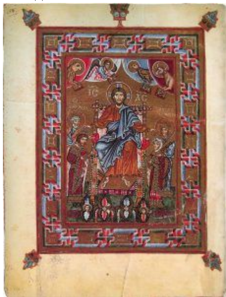
Кодекс Гертруди із зображенням коронації Ісусом Христом Ярополка Ізяславовича

Активні матримоніальні контакти представників династії Рюриковичів із західними королівськими родинами упродовж кінця X–XI ст. суттєво розширили сфери політичних інтересів руських князів, родичами яких тепер були французькі, німецькі, англосаксонські, польські, угорські, норвезькі суверени. До Києва та інших князівських осередків поступово проникали не тільки товари, але й знання про країни Західної Європи, їхній уклад, систему управління та ієрархію, предмети культу, книги тощо. Такий тісний зв'язок із «західним світом» дозволяв доволі часто окремим руським володарям за несприятливих для себе обставин на батьківщині, шукати притулку саме там, часто із помітними політичними наслідками.