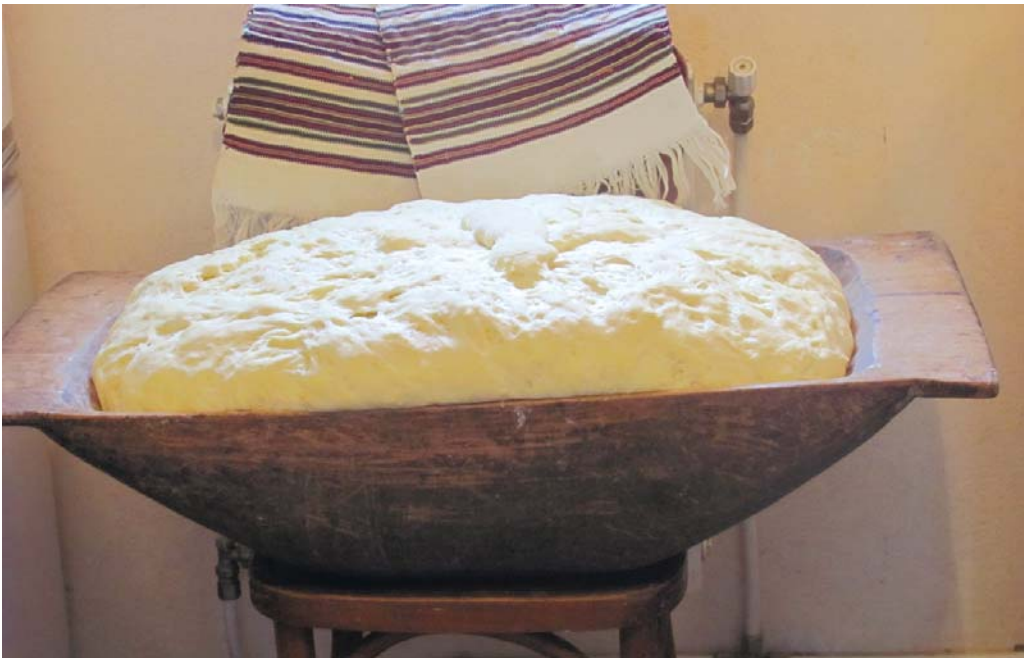
На паскí / на колач'í / на хл'іп зам'іс'у́йут у тако́му корíт'і.