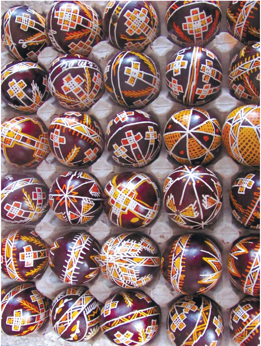
Отут ікрас җе клан'а т'удиҗскіх писанок.