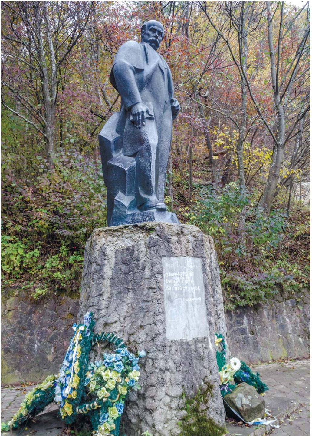
Тепер'ішній пámн'ітник Шеўч'энкови / він тут Сокі́лским / алé ни на тим м'ісци / де буў уперёт.