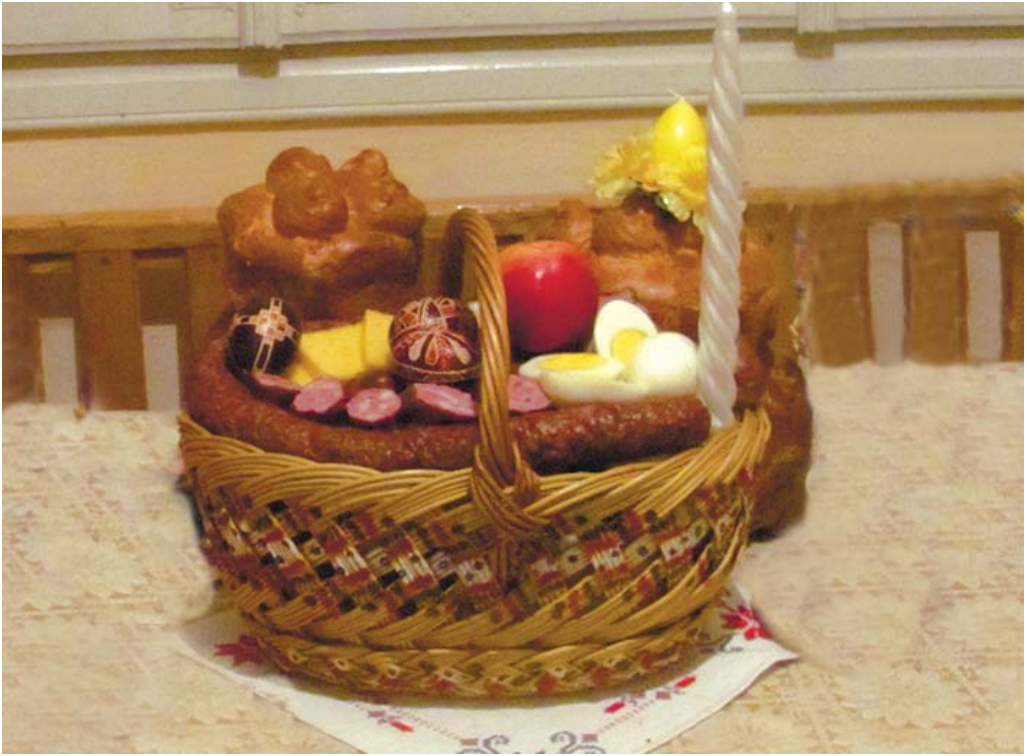
Оц:é йе т'удиўскій кошéлик з дорóў / отáк вин вигл'іда́йі.