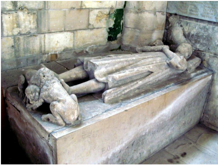
Надгробок Рауля де Крепі. Церква св. Петра в Мондід'є (Франція)

це часто (ба, майже завжди) траплялося в руських землях із вінченосними вдовами, а, попри канонічні застереження й напоумлення церковних архієреїв, все ж у 1061/1062 р. вдруге взяла шлюб. Вона вийшла заміж за колишнього ворога Генріха I – одіозного графа Рауля де Крепі з роду Валуа († 1074).