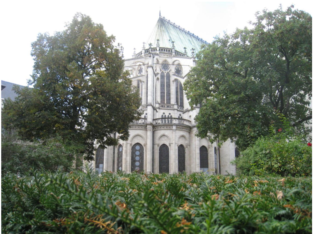
Абатство Сен-Дені (Париж, Франція). Місце поховання короля Генріха I

Опосередковано мусила посприяти шлюбові й інформація про мощі святого папи Климента († між 97/100), котрі перебували у Києві й стали відомими за посередництвом Бруно з Кверфурта (974–1009) французькому хроністу Адемарові Шабанському (988–1034). За переконанням останнього – саме загиблій мученицькою смертю від рук прусів св. Бруно хрестив Русь, володарі якої, відтак, в рецепції християнської ідеології і світогляду представників двору Капетингів напередодні укладення Генріхом I свого другого шлюбу, отримували додаткові бонуси. Відомості про мощі св. Климента імовірно синхронно збирав і канонік собору в Реймсі Одальрик, добре знайомий із учасником французького посольства до Києва у 1049 р. шалонським єпископом Роже II (1042–1066), котрий, мабуть, разом з іншими посланцями, озвучив батькові нареченої пропозицію укладення матримоніального союзу.