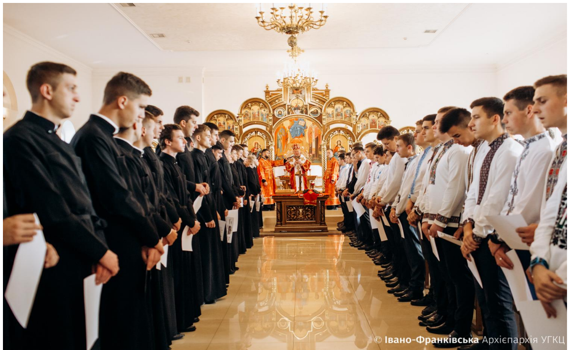
Урочиста посвята підрясників у ІФДС (2019 рік)