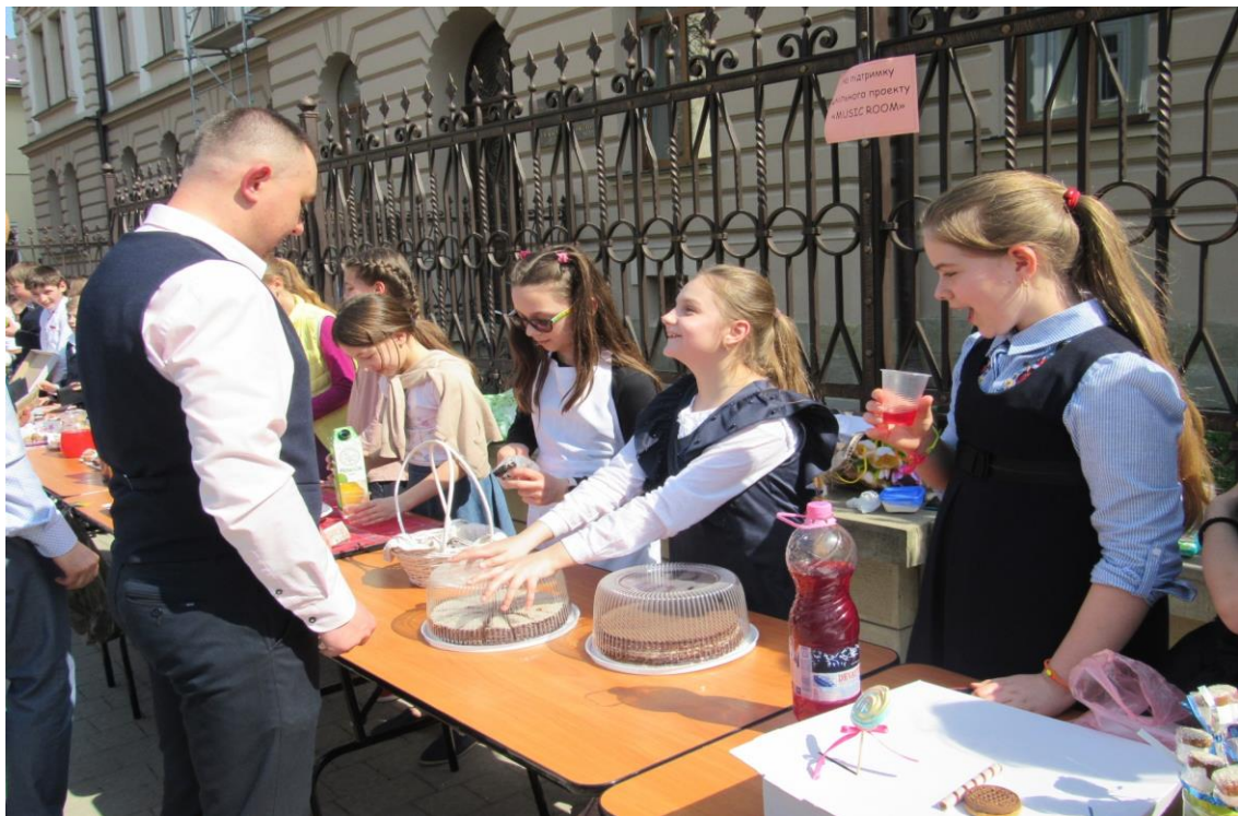
Благодійний ярмарок на підтримку воїнів АТО (12.04.2018р.)