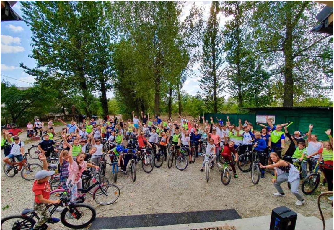
Традиційний велопробіг спільноти ліцею (06.09.2019р.)