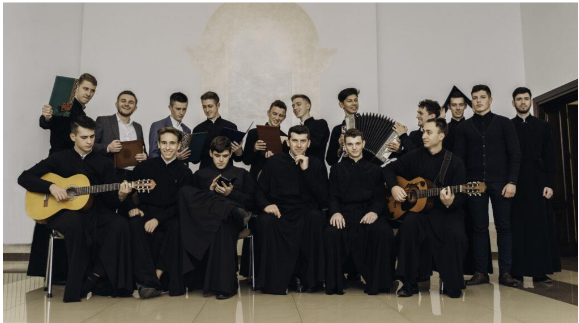
Культурно-мистецький відділ ІФДС (2016 рік)