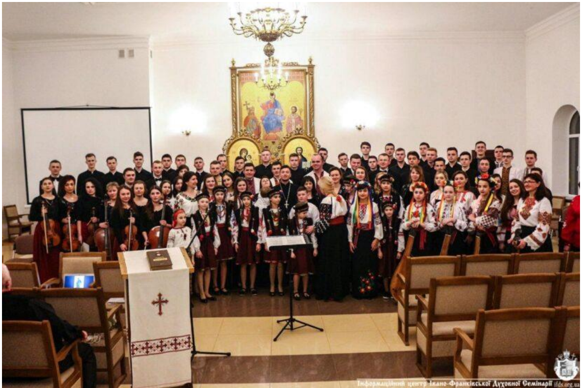
Шевченківський вечір 09.03.2019 р.