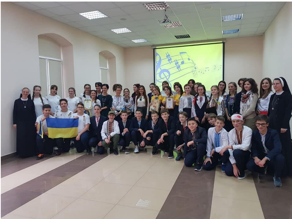
Вечів талантів у Католицькому ліцеї (16.10.2020р.)