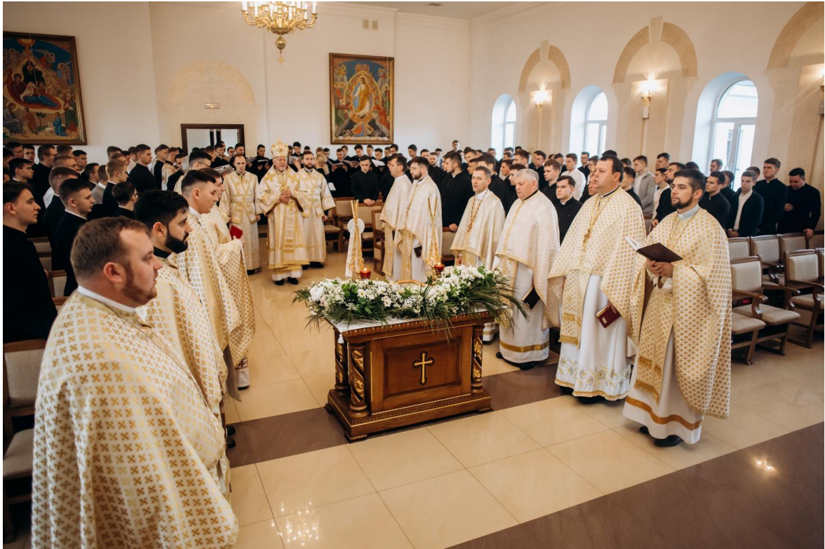
Храмовий празник священномученика Йосафата в ІФДС (2020 рік)