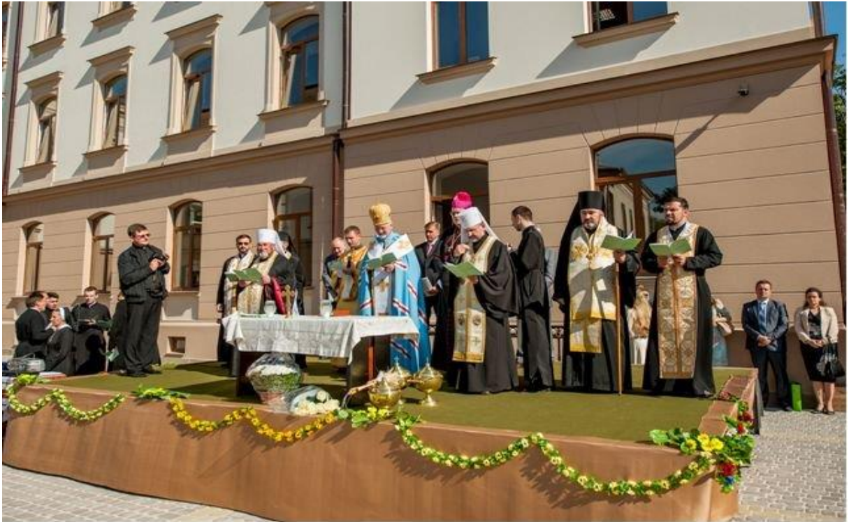
Освячення нового корпусу Католицького ліцею (16.09.2014р.)

Світлини з діяльності Католицького ліцею, м. Івано-Франківська