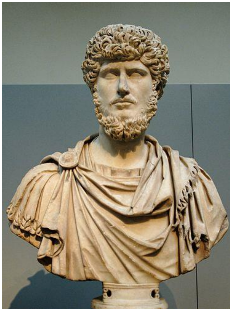
Марк Аврелій [61]