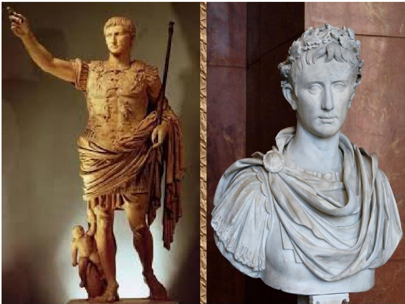
Октавіан Август [61]