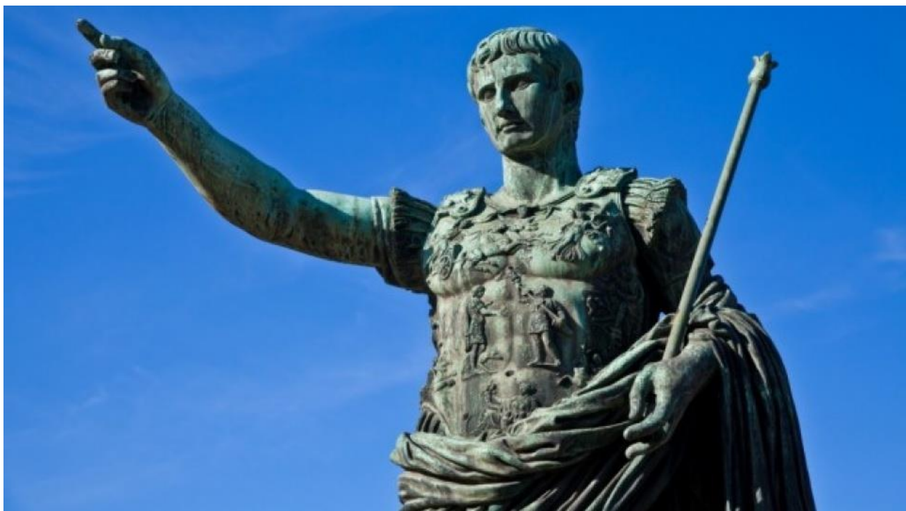
Гай Юлій Цезар [61]