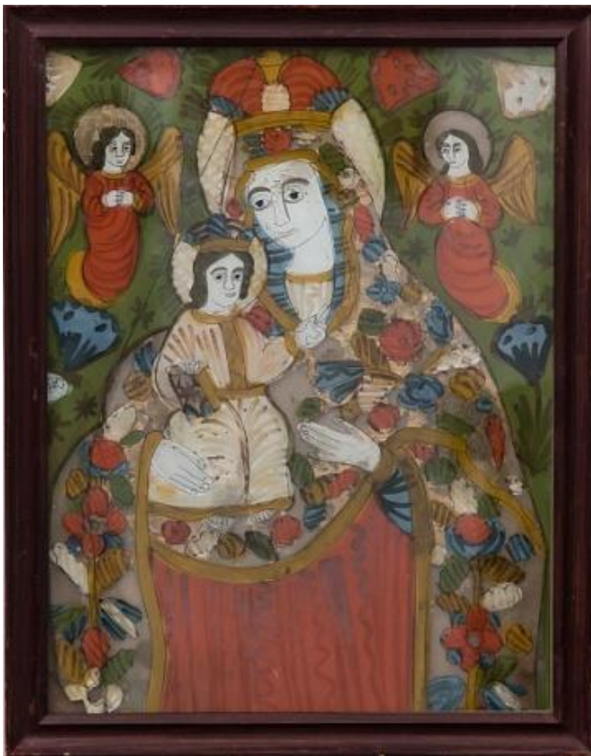
Рис. А. 2. 1. 11. Ікона «Богородиці з Дитям». Виготовлена з використанням розпису на склі [13].