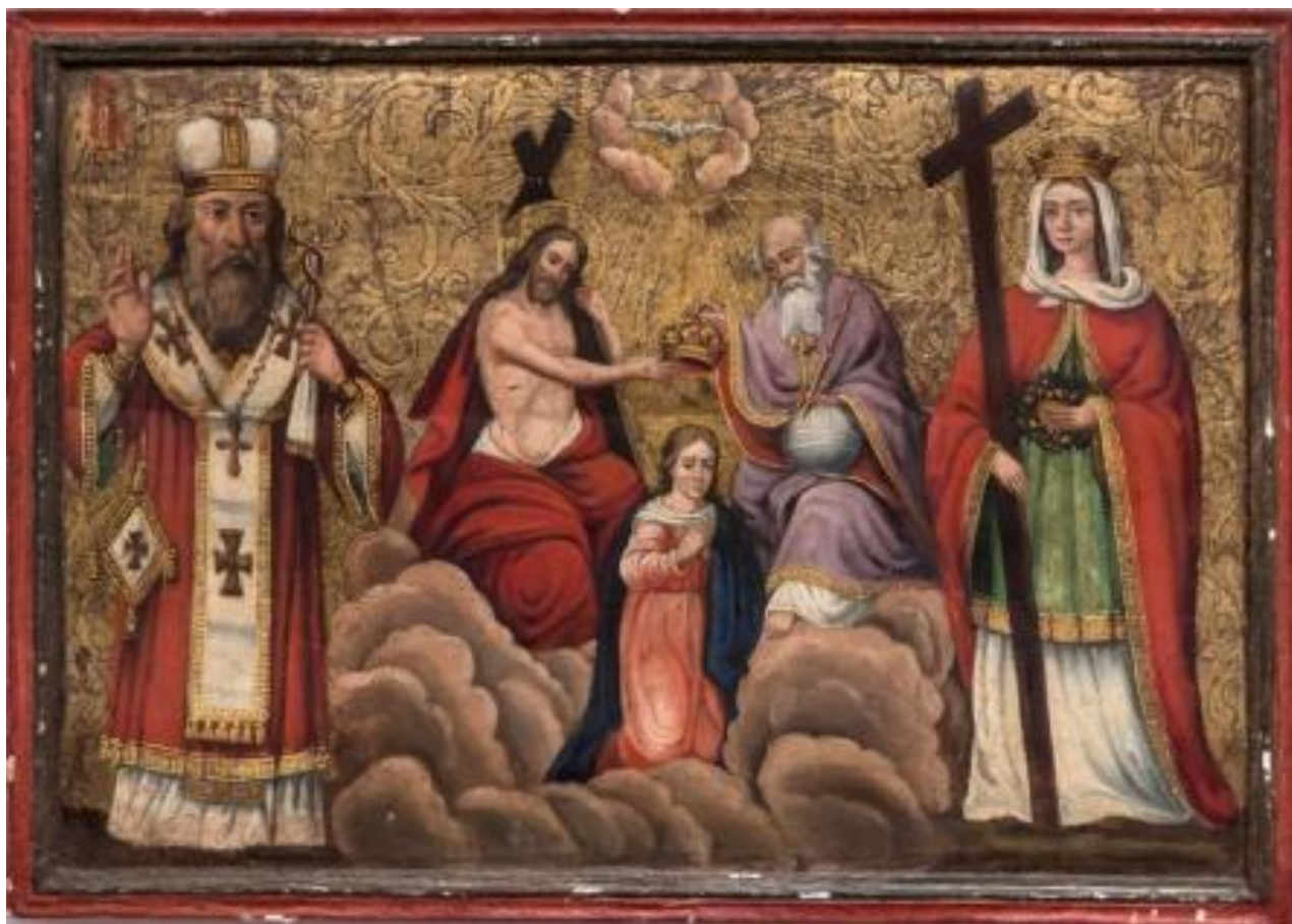
Рис. А. 2. 1. 10. Ікона «Коронування Марії» зображає Богородицю у вигляді Небесної цариці. Виготовлена у ХІХ столітті в м. Коломия на дерев'яній основі [12].