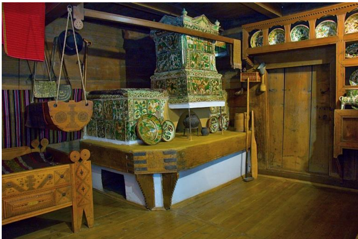
Рис. А. 2.1.1. Реконструкція інтер'єру житла кінця ХІХ ст.