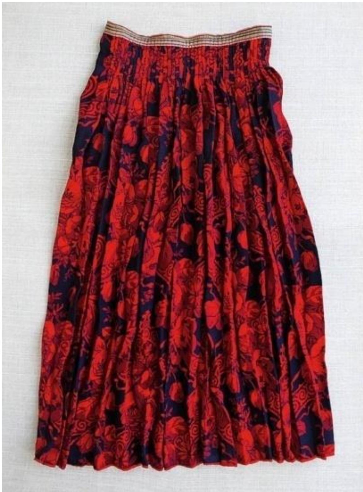
Рис. А. 2. 2. 17. Весільна спідниця виготовлена з фабричної тканини у складки з поясом для зав'язування. На червоному фоні зображені великі квіти. 1910 р. [16].