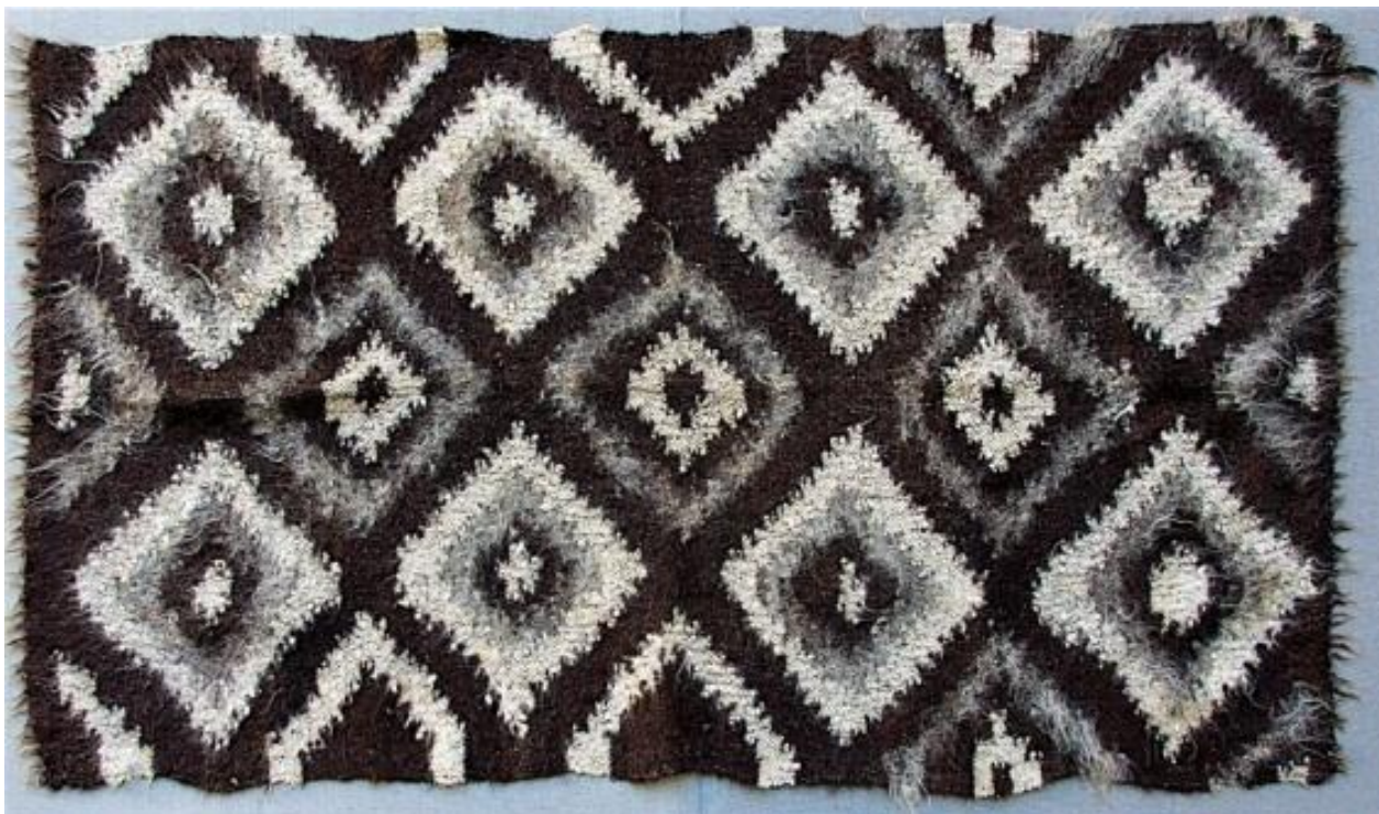
Рис. А. 2. 1. 8. Ліжник прямокутної форми із назвою «очканий». Витканий з вовняних ниток в чорно – білих тонах із орнаментом ромба [10].