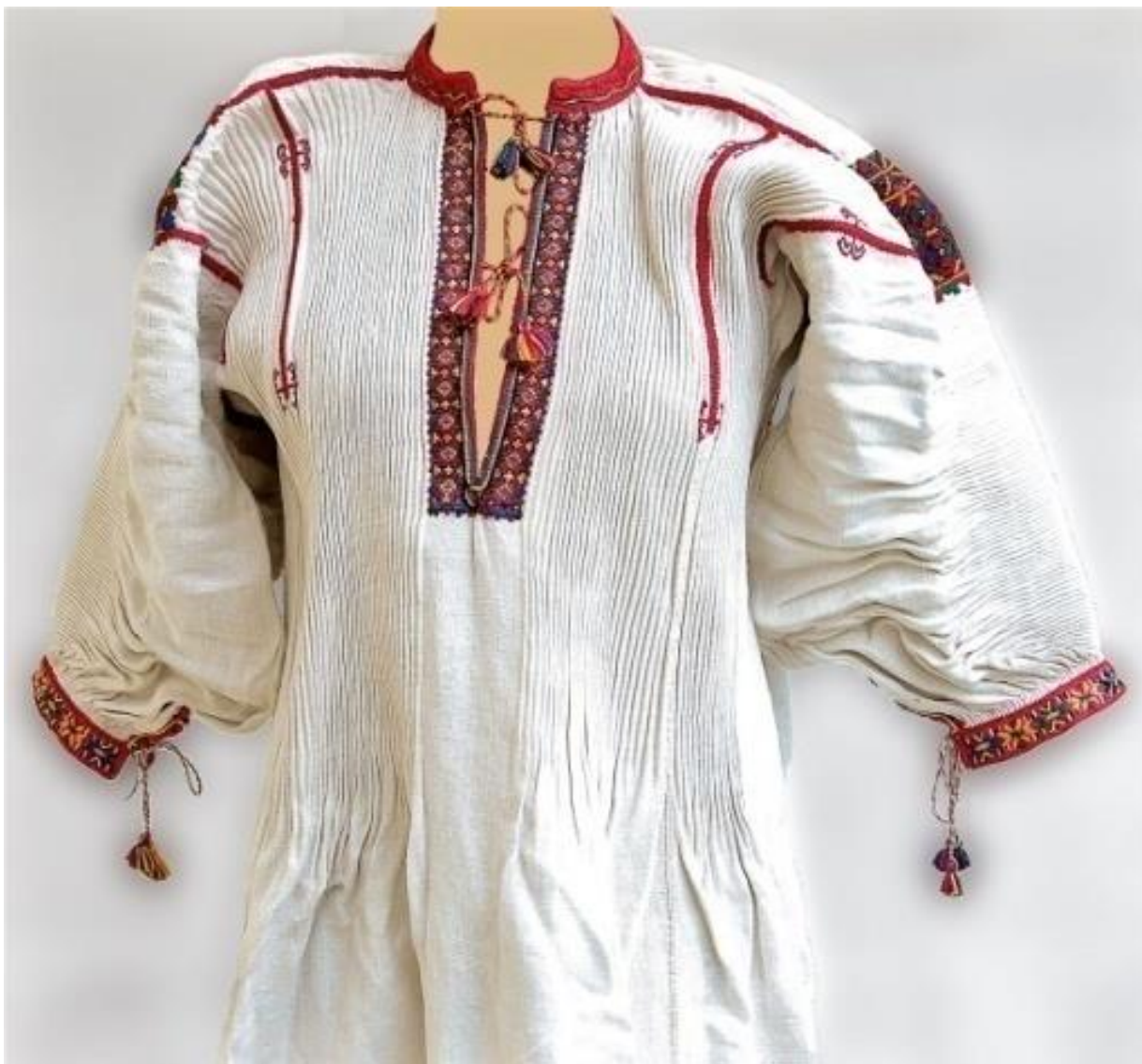
Рис. А. 2. 2. 16. Жіноча сорочка на домотканому полотні верхня частина якої рисована в дрібну складку. Вишита червоними, рожевими, жовтими, темно – зеленими та синіми нитками. Прикрашена ромбами у поєднанні з квітами [15].