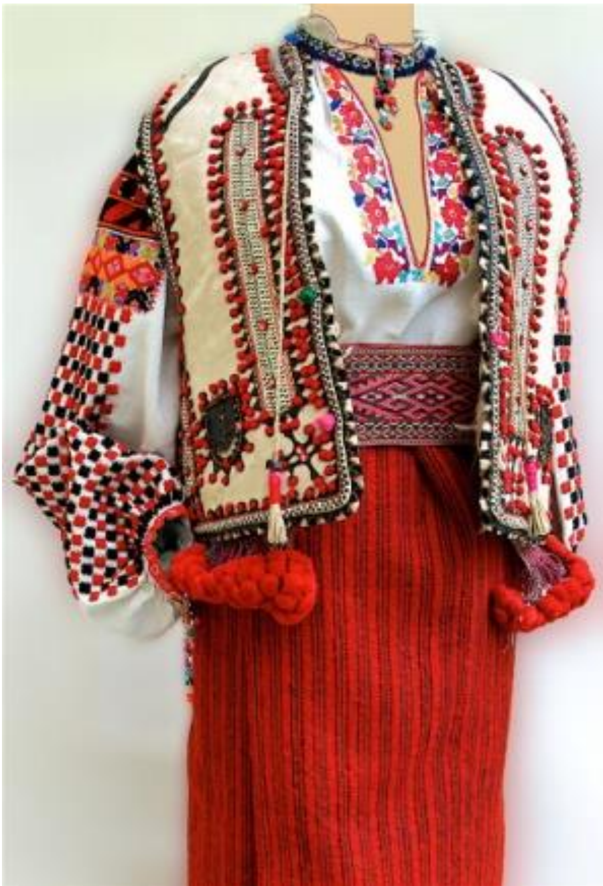
Рис. А. 2. 2. 14. Комплект жіночого одягу до якого входить: кептар, сорочка, запаска, пояс [14].