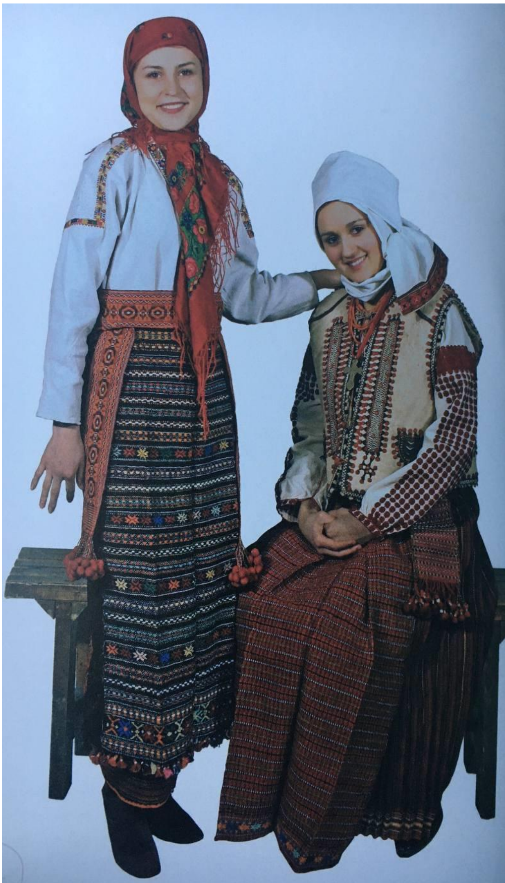
Рис. А. 2. 2. 15. Комплекс жіночого святкового вбрання [54, с. 82].