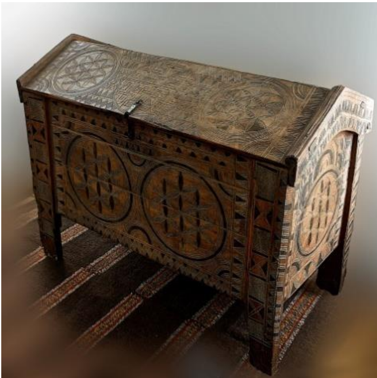
Рис. А. 2.1.3. Дерев'яна скриня різьблена [5].