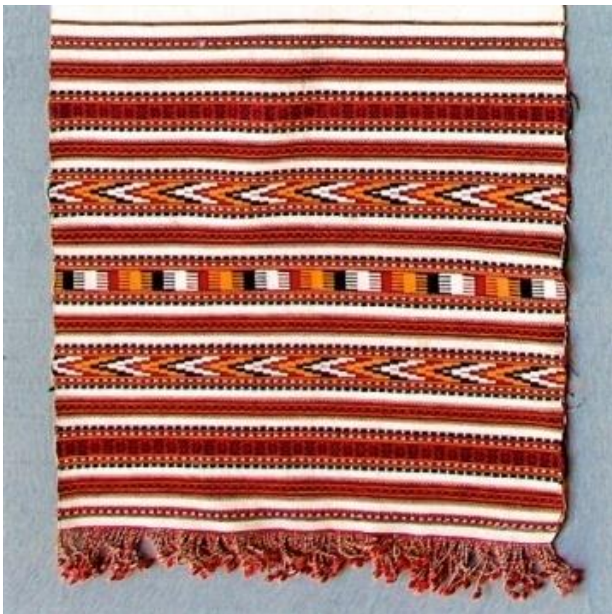
Рис. А. 2. 1. 12. Скатерть виткана у жовто – червоних тонах та орнаментована смугами [17].