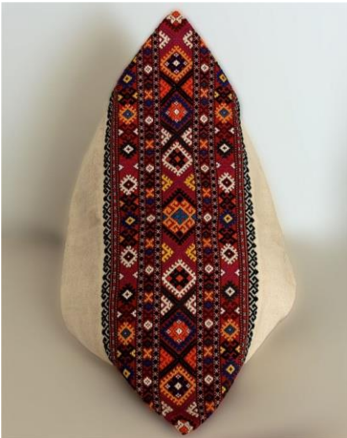
Рис. А. 2.1. 13. Пішва або наволочка з виткана на вишневому фоні з геометричним орнаментом червоних, жовтих, синіх, оранжевих, рожевих та темно зелених кольорів [18].