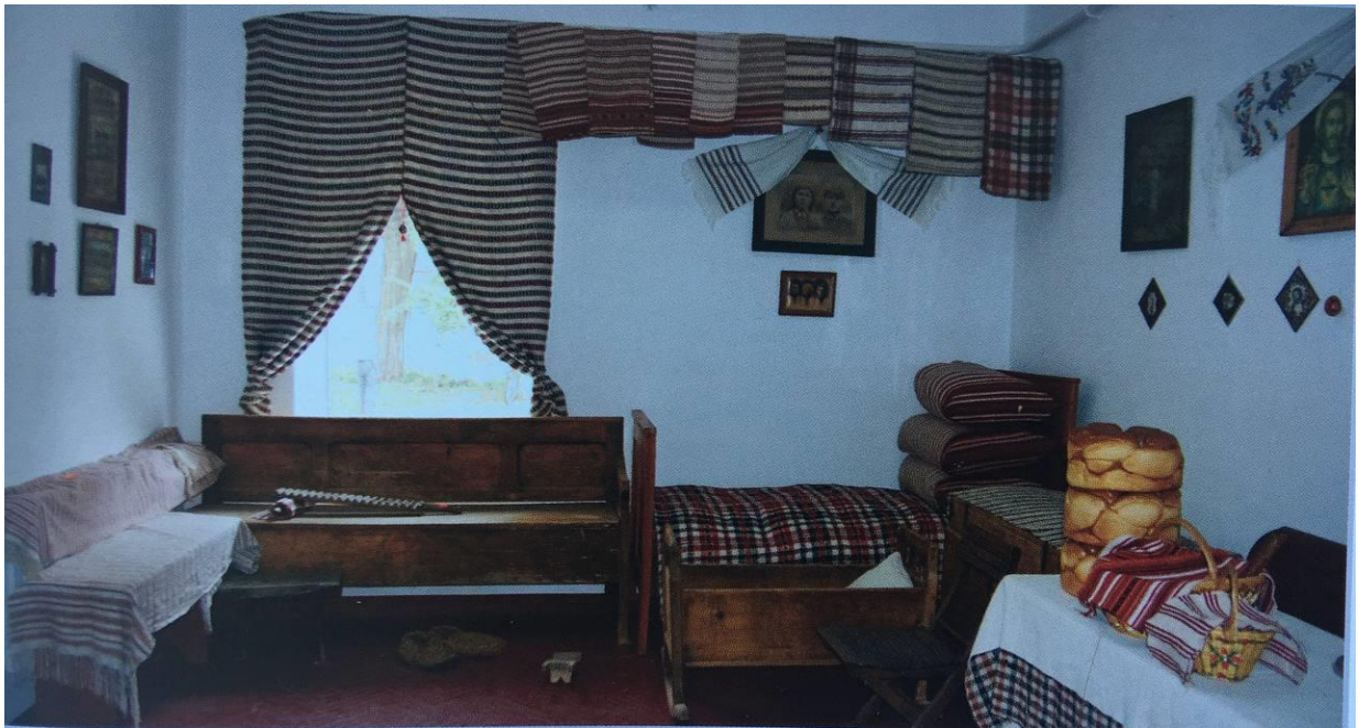
Рис. А. 2.1.2. Реконструкція інтер'єру кімнати поч. ХХ ст. [72, с. 259].