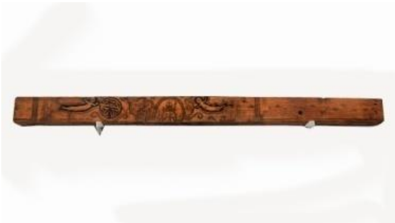
Рис. А. 2.1.4. Сволоок ХІХ століття [6].