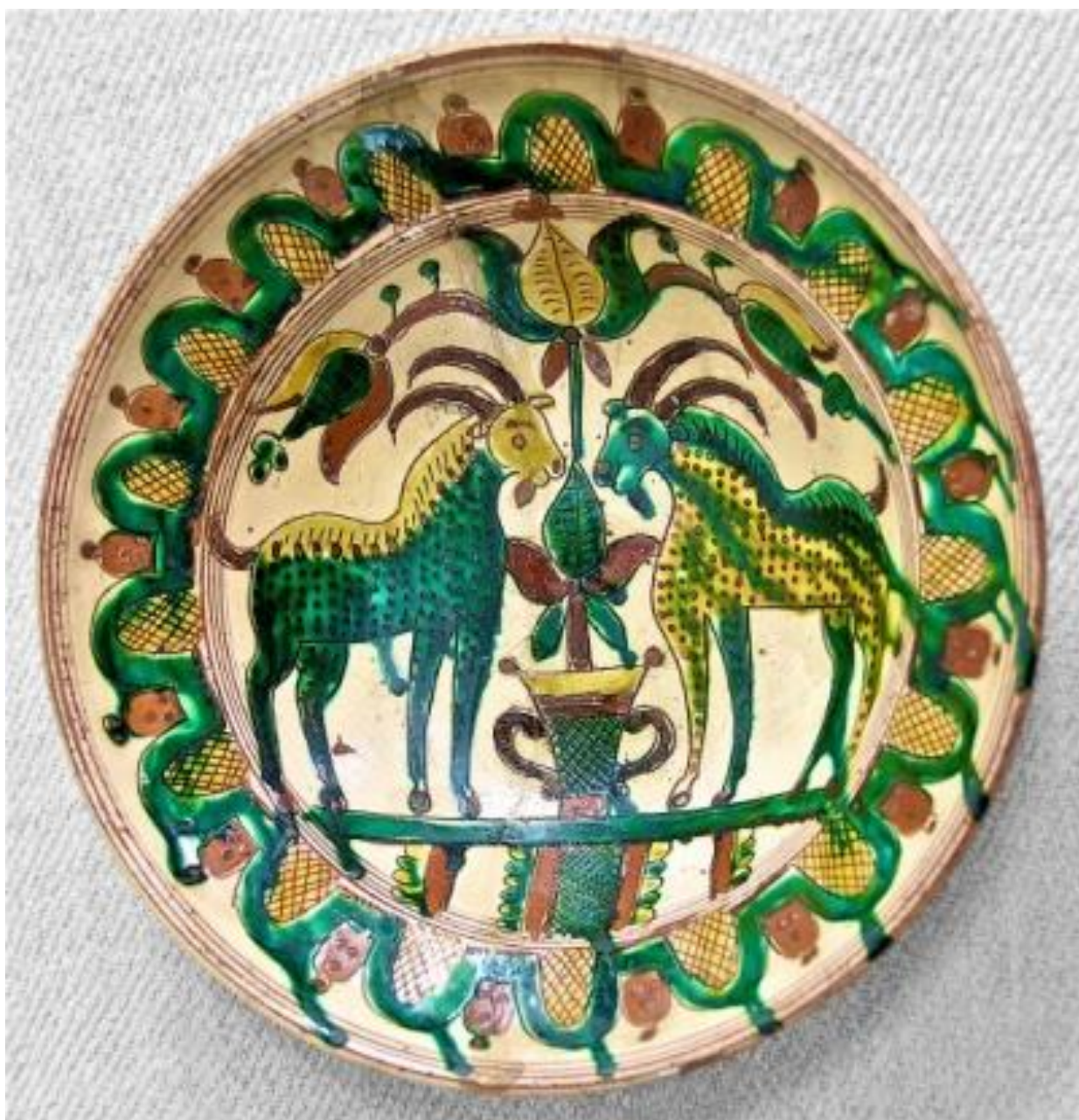
Рис. А. 2. 1. 5. Глиняна миска «Два цапки на кладці» розмальована переважно зеленими, жовтими, а також коричневими кольорами. В оздоблені використаний тваринний і ослинний орнамент, а по краях дужки з «кільчатим письмом» [7].