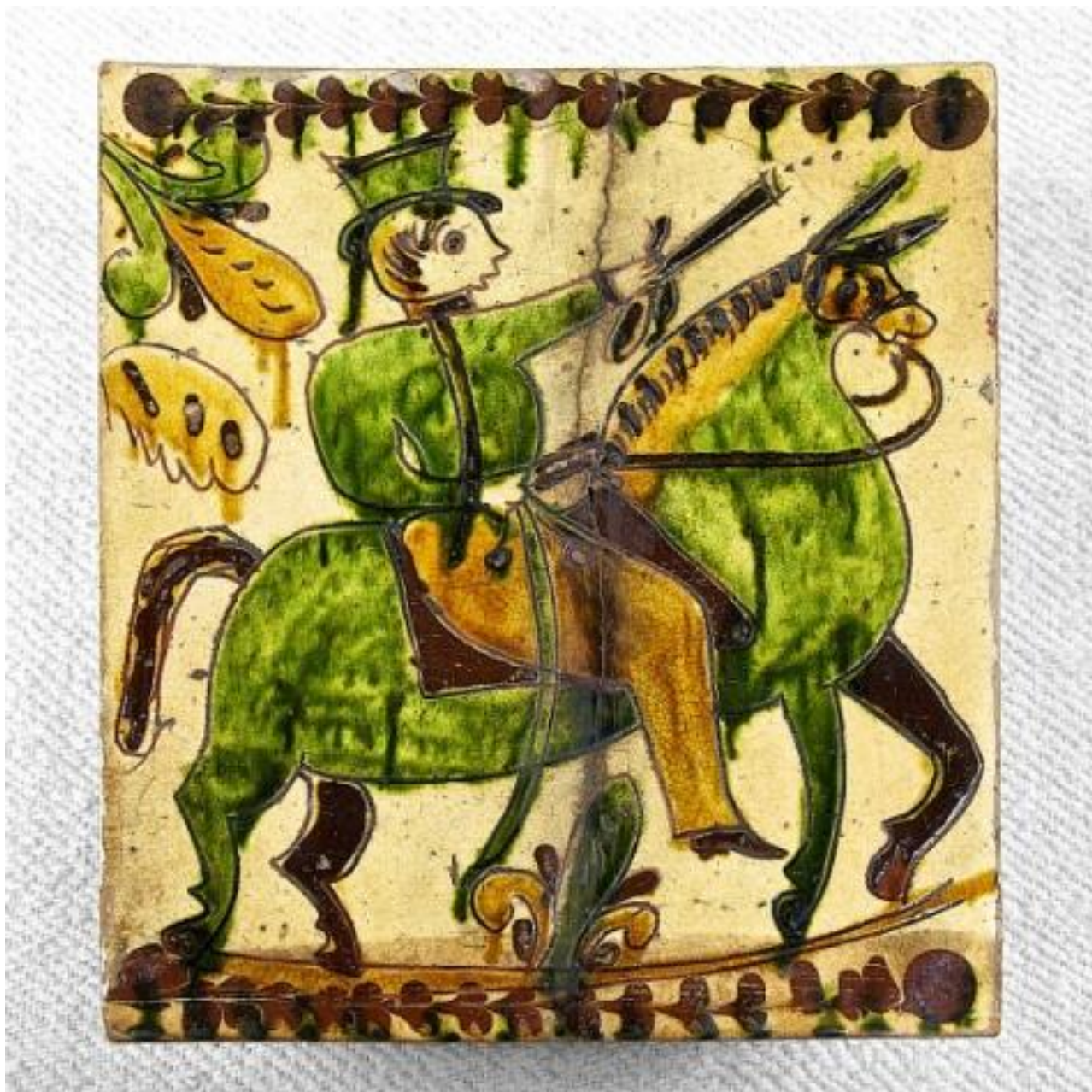
Рис. А. 2. 1. 7. Кахля «Вершник» розписана в зелених, жовтих та коричневих тонах. Зображає вершника із зброєю (пістолетом), що їде на коні. А також присутній рослинний орнамент, зокрема квітка [9].