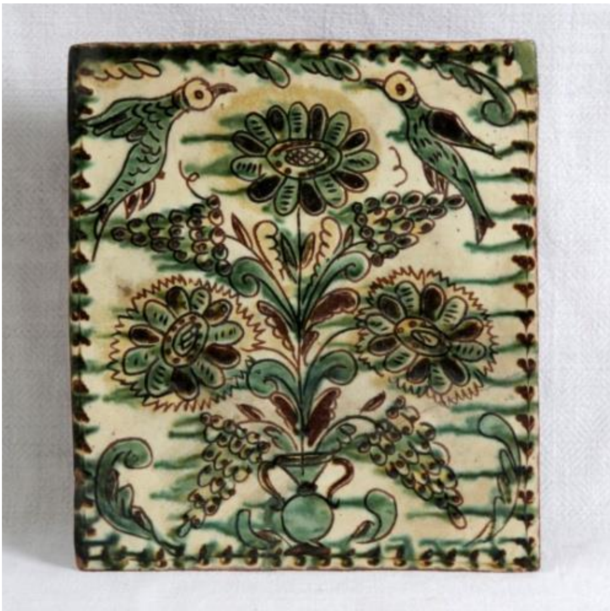
Рис. А. 2. 1. 6. Кахля з рослинним орнаментом з двома птахами. Виконана переважно в зелених, жовтих та коричневих тонах [8].