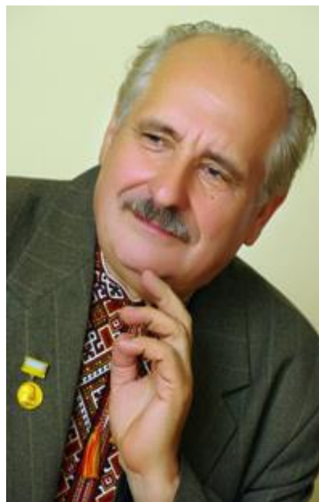
Пушик Степан – літератор, викладач, народний депутат України, голова обласного Твариства українсь кої мови імені Т.Шевченка