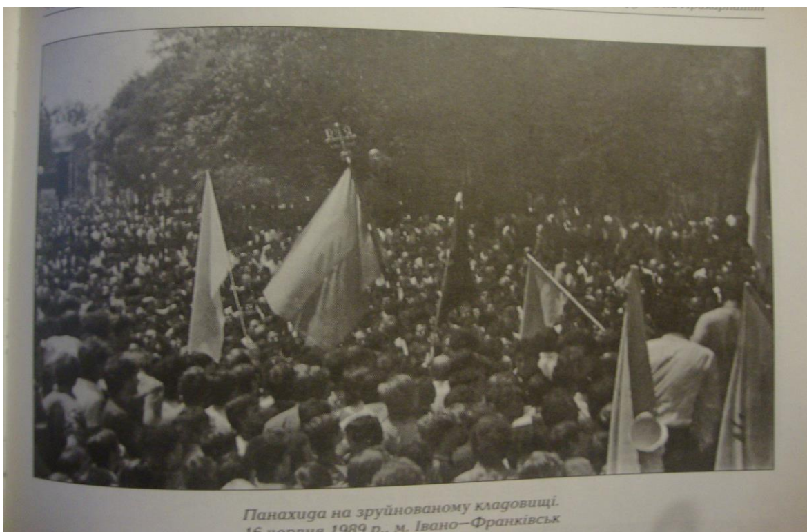
Панахида на зруйнованому кладовищі. 16 червня 1989 р., м. Івано-Франківськ