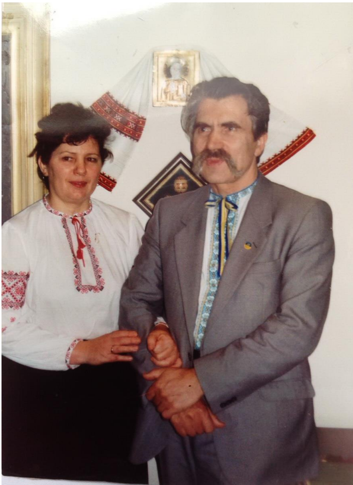
Лукияненко Левко – дисидент, голова УГС, народний депутат України від Івано-Франківська, автор тексту Акту проголошення незалежності України з дружиною Стасів Надією, активісткою Івано-Франківської філії УГС