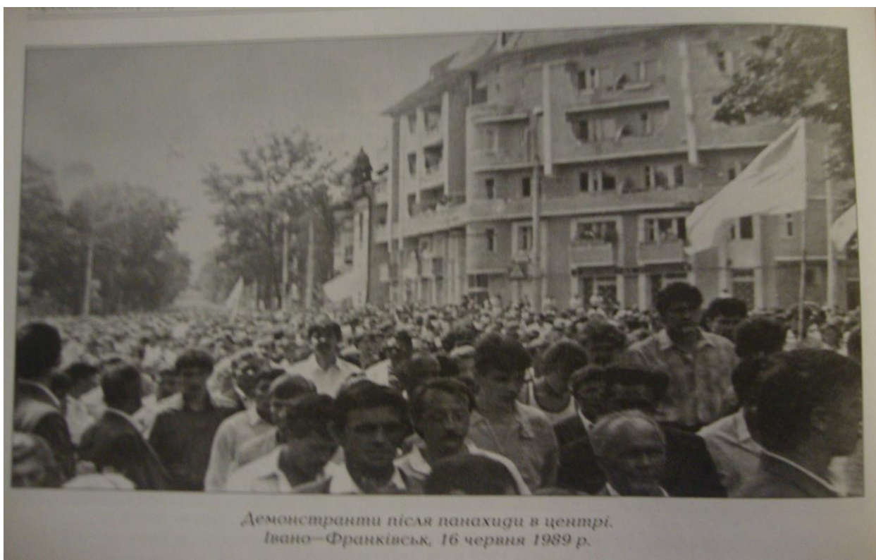
Демонстранти після панахиди в центрі. Івано-Франківськ, 16 червня 1989 р.

Панахида у меморіальному сквері Івано-Франківська і демонстрація вулицями міста під синьо-жовтими прапорами 18 червня 1989 р.