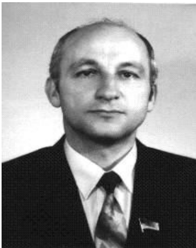
Волковецький Степан – інженер, викладач, народний депутат України, депутат Івано-Франківської обласної ради