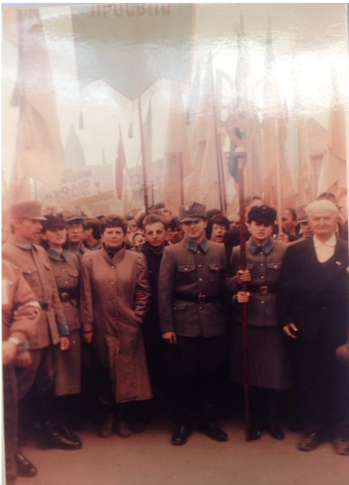
Маніфестація за участю акторів Галицького молодого театру у формі УСС