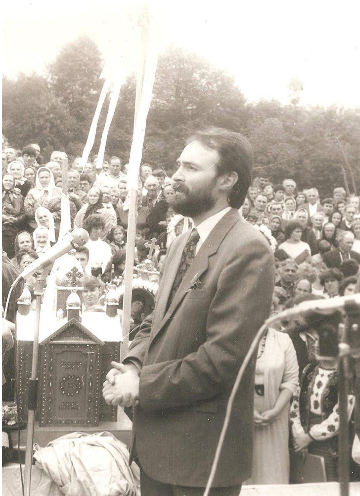
Микола Яковина – художник, голова обласної організації НРУ, голова Івано-Франківської обласної ради народних депутатів