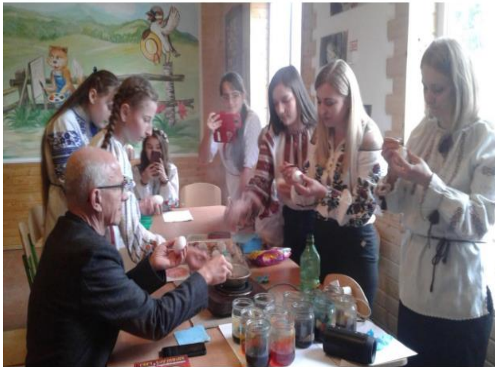
Рис. В. 4. Майстер-клас з розпису писанок у школі с. Липовиця[97].