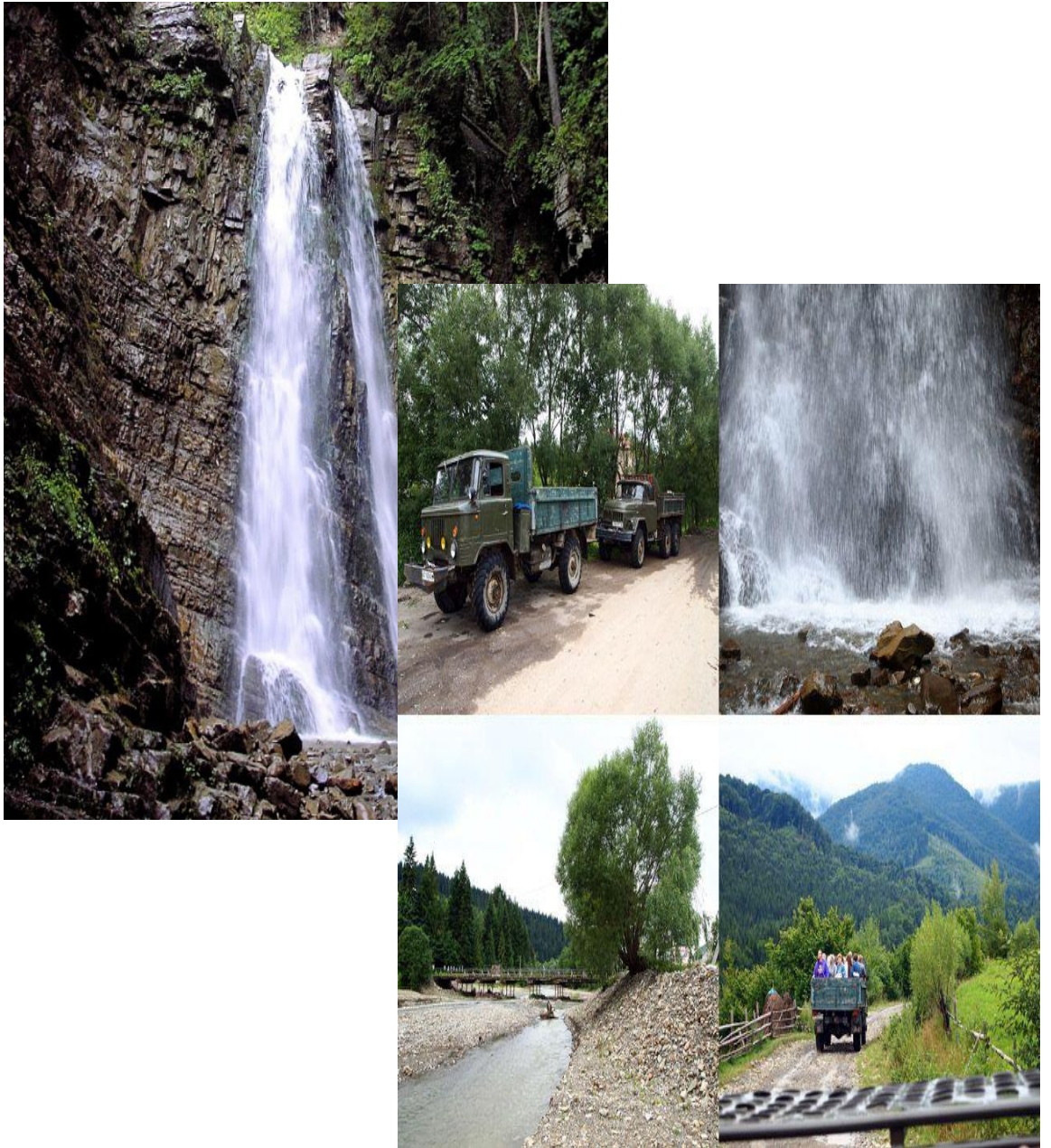
Рис. Б.1. Дорога до Манявського водоспаду