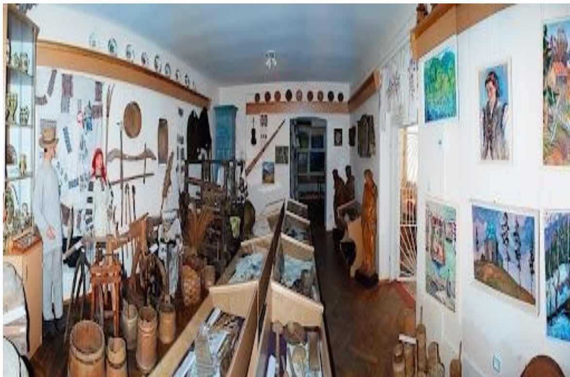
Рис. А.1. Музей Бойківщини, відкритий у 2004 р. під час святкування Другого міжнародного фестивалю «Бойківська ватра-2004»