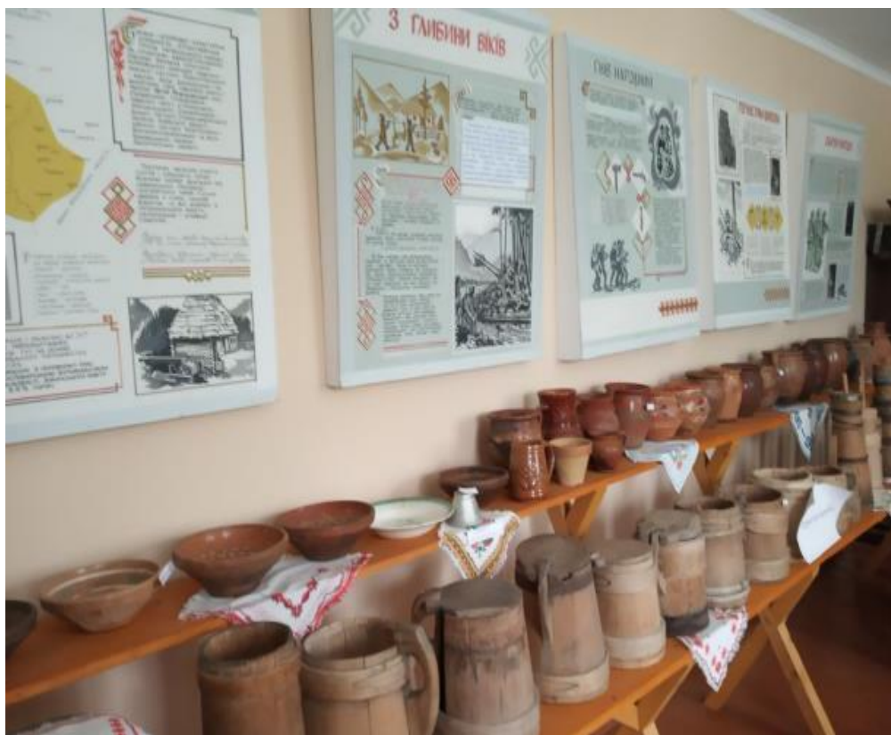
Рис. В. 3. Шкільний музей у с. Липовиця[97].