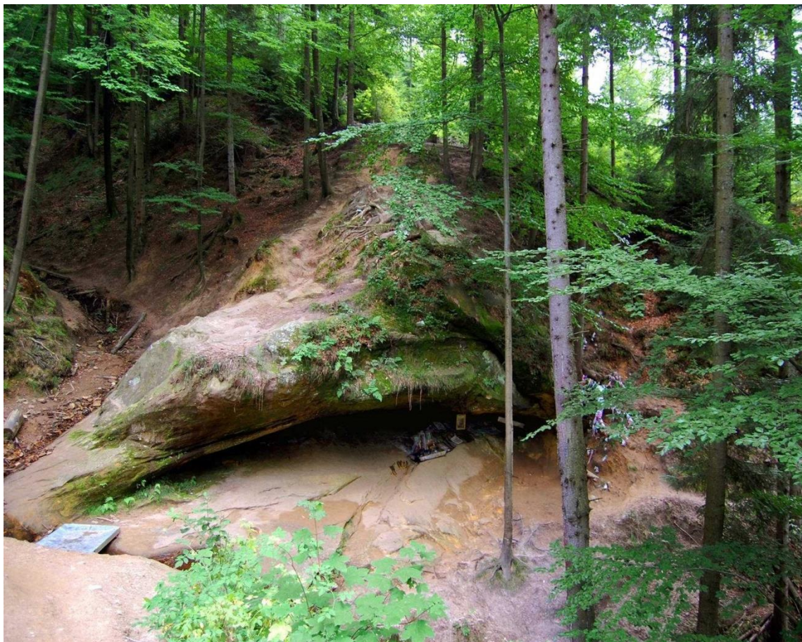
Рис. Б.2. Блаженный камінь