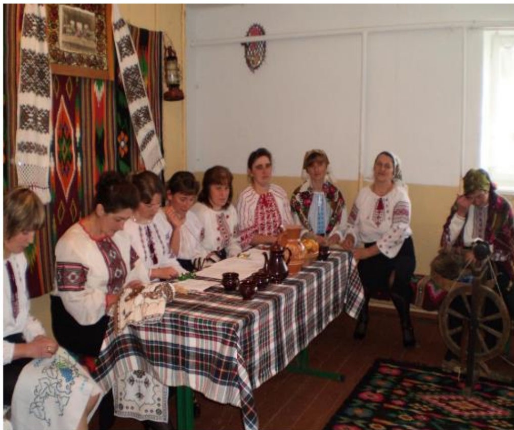
Рис. В.2. Липовицьківечорниці[97].