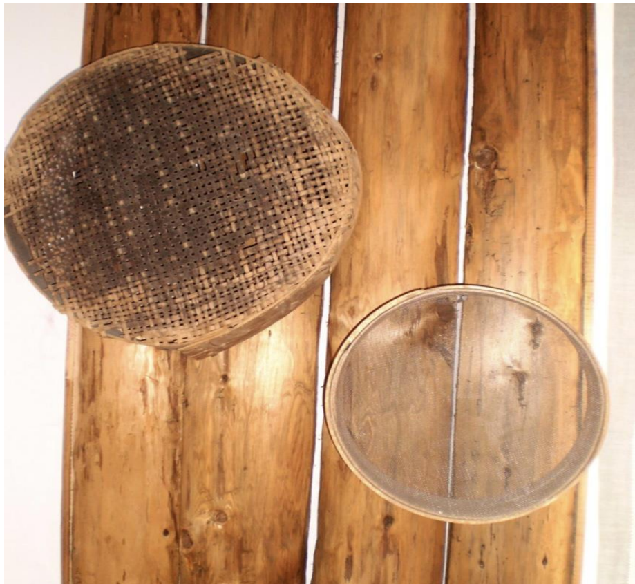
Рис. А. 3. Решето з ліщини XIX ст. Сито з сітки початку XX ст. в музеї історії етнографії села Липовиця ЗОШ І-ІІІ ст. Рожнятівської районної ради Івано-Франківської обл.