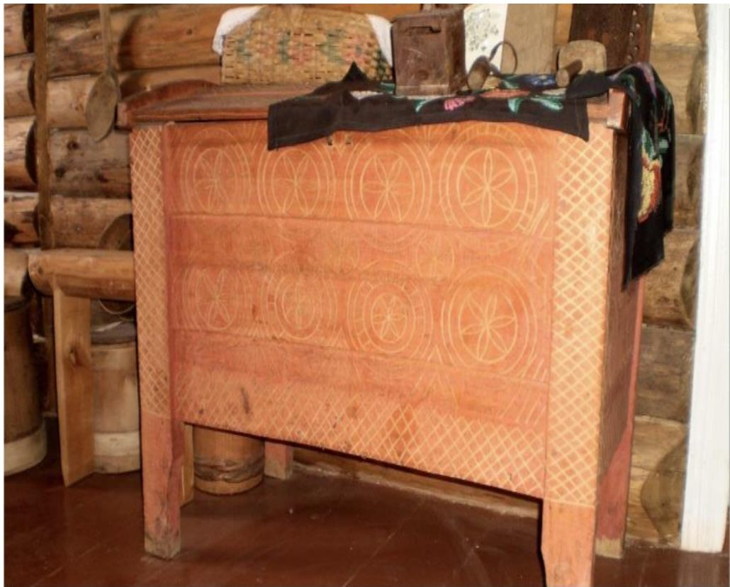
Рис. А. 2. Бойківська скриня кінця ХІХ ст. в музеї історії етнографії села Липовиця ЗОШ І-ІІІ ст. Рожнятівської районної ради Івано-Франківської обл.