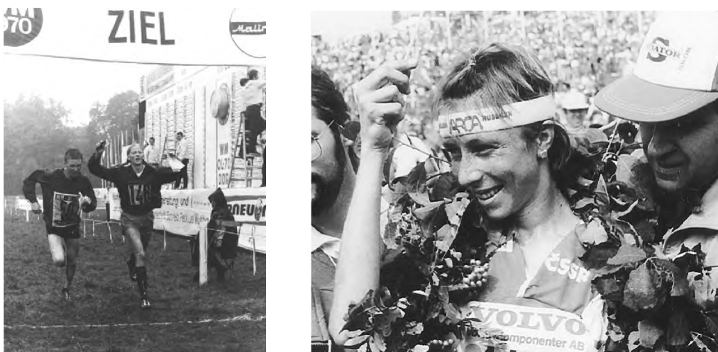
Рис. 3. Переможний фініш та нагородження. Чемпіонат світу 1970 р., 1989 р.

Природно, що першими практичними кроками нової федерації стало проведення офіційних міжнародних змагань. У 1962 і 1964 роках відбулися дві першості Європи. Звання першого європейського чемпіона вибороли норвежець М.Лістад і шведка У.Ліндквіст. На третьому конгресі Міжнародної федерації орієнтування, що відбувся в Болгарії 1965 р., було ухвалено рішення про проведення чемпіонатів світу (рис. 2) раз у два роки, щоправда, коло учасників світової першості, що проходила у Фінляндії в 1966 р., обмежилося представниками європейського спорту. Значний успіх на цих змаганнях супроводжував збірну Швеції, що завоювала три золоті медалі. Шведи виграли також чоловічу й жіночу естафети.