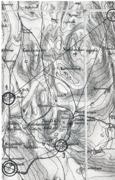
Рис. 1. Перша карта для змагань зі спортивного орієнтування 31.10.1897 року. Масштаб 1:30000, перетин 20 м

Результати дослідження. Офіційно батьківщиною орієнтування вважається Норвегія, де 31 жовтня 1897 році було організовано перші офіційні змагання (рис. 1) зі спортивного орієнтування [1; 4; 9; 11; 12; 13].