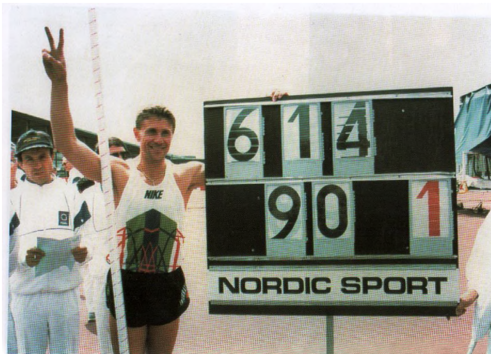
Фото 2. Сергій Бубка під час встановлення рекорду світу зі стрибків із жердиною

“Як спортсмен, я завжди заряджений на перемогу!” – С.Н.Бубка.