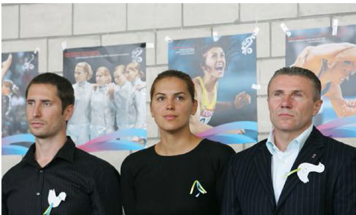
Фото 3. Президент Олімпійського комітету України С.Н.Бубка з олімпійськими чемпіонами

Спортивна і суспільна робота С.Н.Бубки – неодноразового рекордсмена і чемпіона світу в стрибках із жердиною – високо оцінена Президентом й урядом України. Він є Героєм України, нагороджений чотирма орденами України, обраний почесним громадянином м. Донецьк і Донецької області, має нагороди СРСР, орден Національного олімпійського комітету Білорусії, почесний доктор Донецького національного університету, почесний доктор Національної спортивної академії Болгарії, почесний доктор Прикарпатського національного університету ім. В.Стефаника.