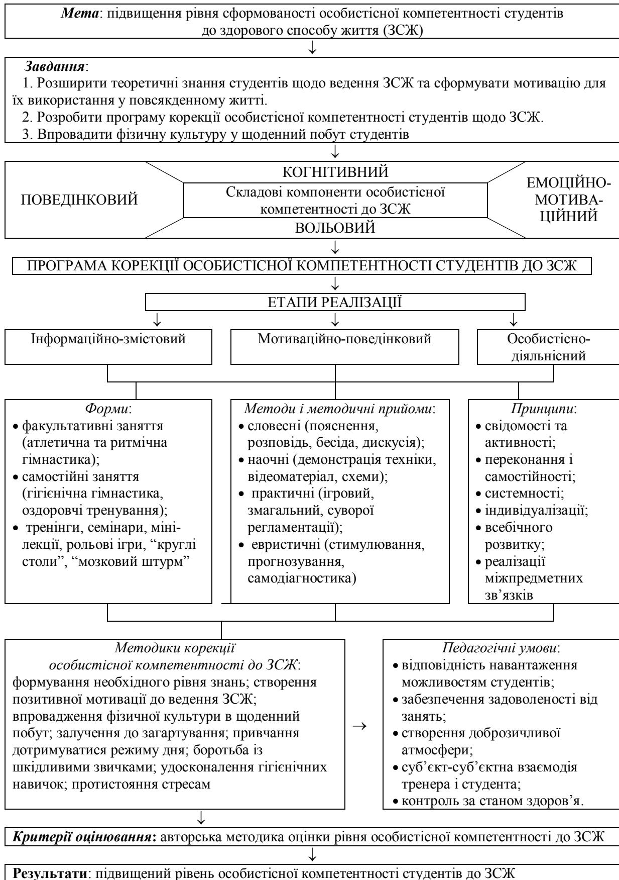
Рис. 1. Модель системи корекції особистісної компетентності студентів до ЗСЖ