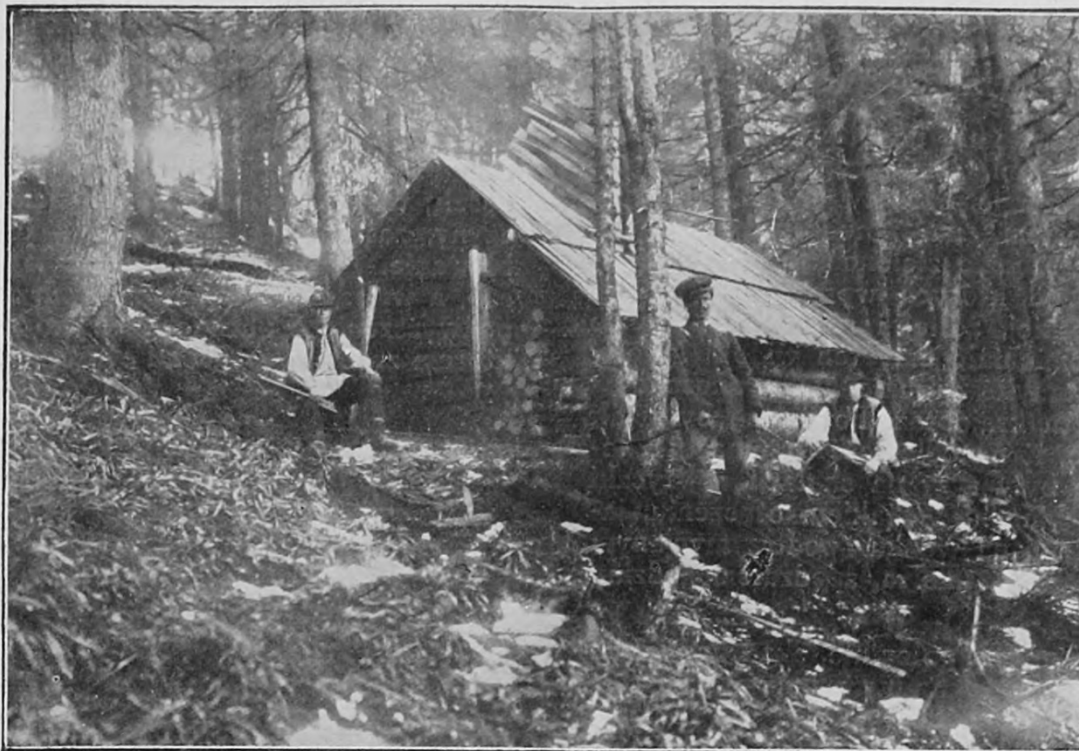
Koliba w nadleśn. Worochta.