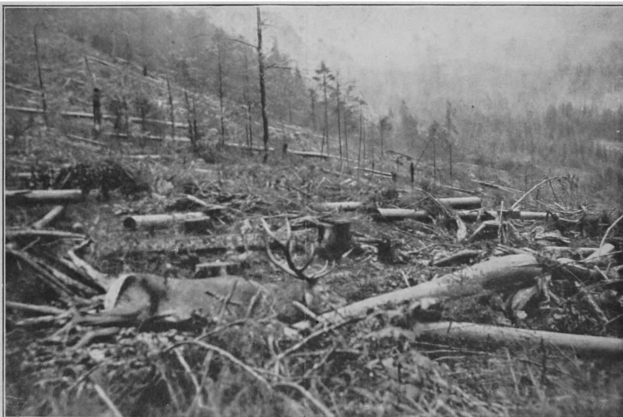
Z rykowiska w Worochcie. Na miejscu strzału.