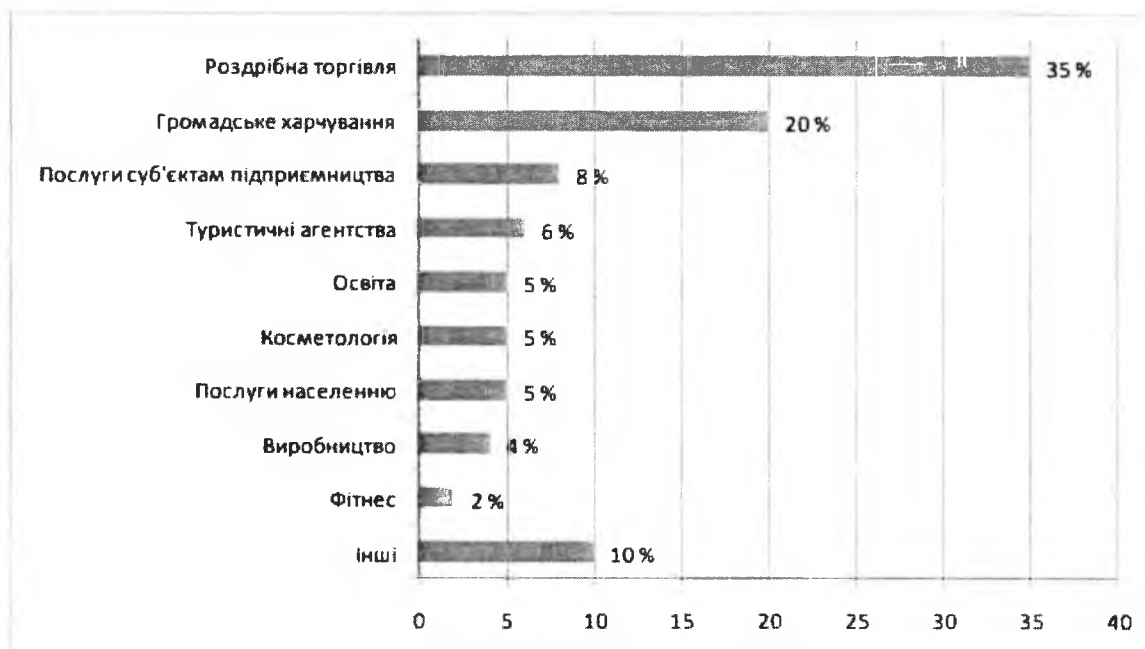
Рис. 2. Структура франчайзингу в Україні [6, 7, 10, 11].

У сучасному суспільстві франчайзинг охоплює багато сфер: громадське харчування (ресторанний бізнес займає найбільшу частку – близько 55% від усіх брендів, які розвивають франчайзинг в Україні), торгівля (ринок роздрібною торгівлі становить близько 35%), проживання (готельному бізнесу посприяло проведення футбольного Євро в 2012р. та пісенного Євробачення в 2017р. в Україні), сфера послуг, яка є досить перспективним напрямом розвитку франчайзингу. Перелік послуг, які надаються із використанням франчайзингу в Україні подано нижче (рис. 2).