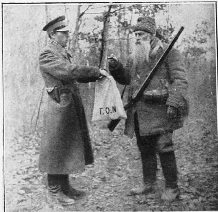
Передача мисливцем гільз для у фонд народної оборони

M Y Ś L I W I z b i e r a j c i e w y s t r z e l o n e ł u s k i n a F. O. N. i o d d a w a j c i e j e ł o w c z y m P o w i a t o w y m