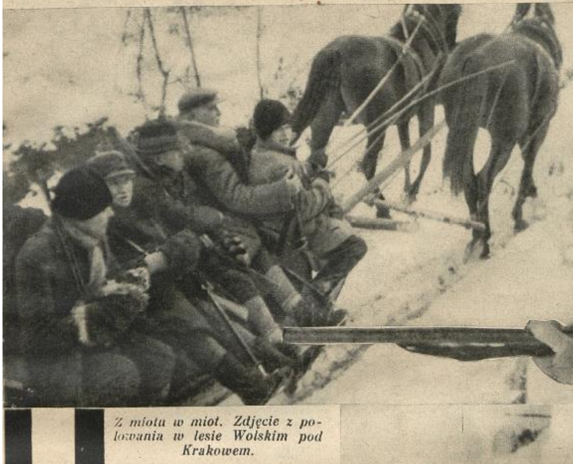
Z miotu w miot. Zdjęcie z polowania w lesie Wolskim pod Krakowem.

Зимове полювання у Вольському лісі біля Кракова