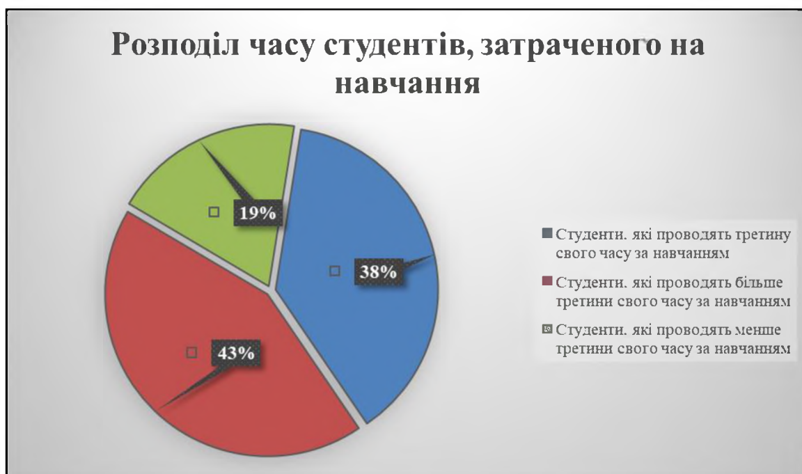
Діаграма 2. Розподіл часу студентів, затраченого на навчання

Навчальний процес у медичних навчальних закладах характеризується ускладненням навчальних програм і зміною системи оцінювання знань студентів. Режим навчання є напруженим. Аналізуючи відповіді, на запитання Скільки часу Ви тратите на навчання, ми отримали такий результат: 1/3 свого часу на навчання тратять 38% студентів, більше 1/3 – 43% і менше 1/3 – 19%. Відповіді свідчать про те, що студенти першокурсники ще не вміють раціонально розподілити час на навчання, а відповідно дозвілля і спорт. (Див. Діаграма 2)