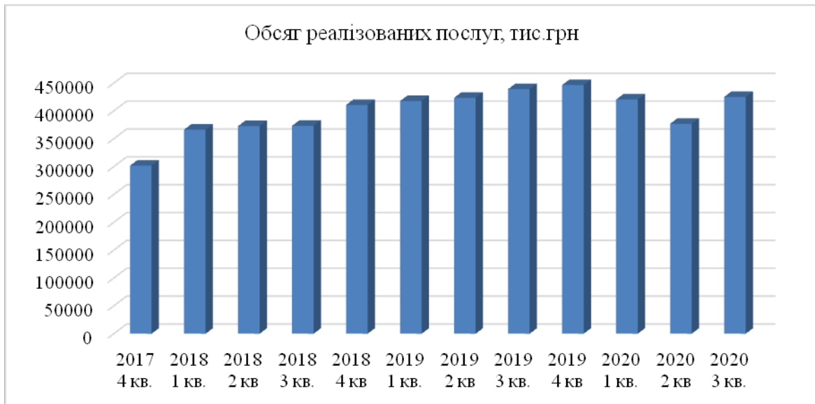
Рис 3. Обсяг реалізованих послуг сфери нерухомості у Волинській області *Згруповано автором за даними [5]