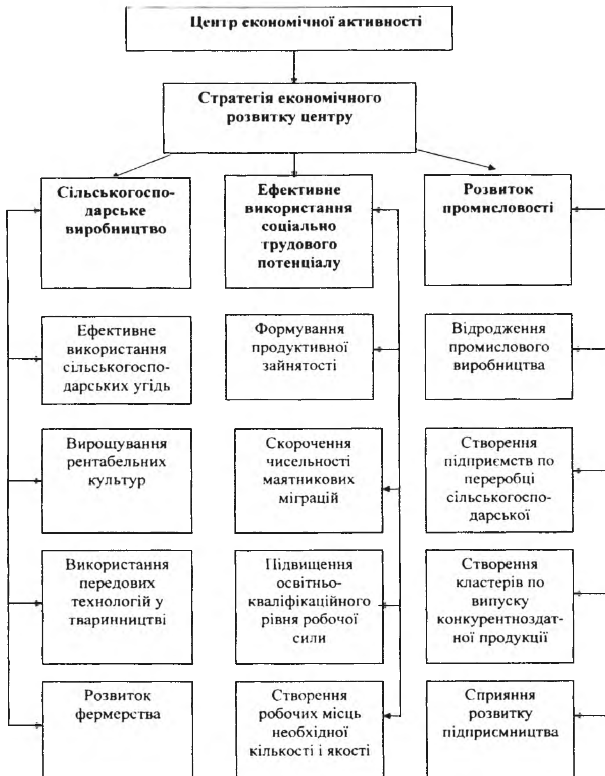
Рис. 3 Стратегія розвитку центру економічної активності

Груповий розвиток територіальних громад означає, що доходи місцевого економі-