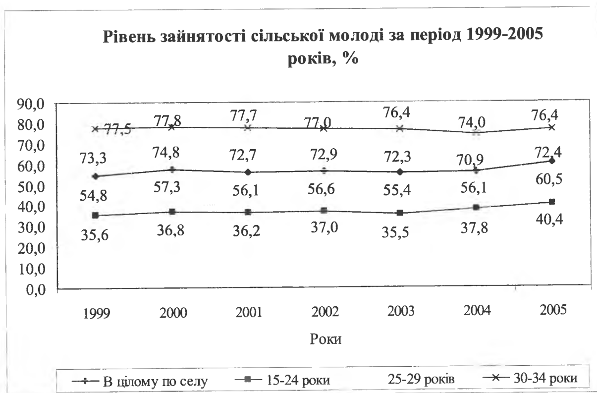
Рис. 1. Рівень зайнятості сільської молоді

Так, протягом останніх семи років загальна чисельність безробітних осіб серед сільської молоді скоротилась із 239,3 тис. чол. у 1999 році до 207,0 тис. чол. у 2005 році, тобто на 32,3 тис. або на 13,5 %. Як і у попе-