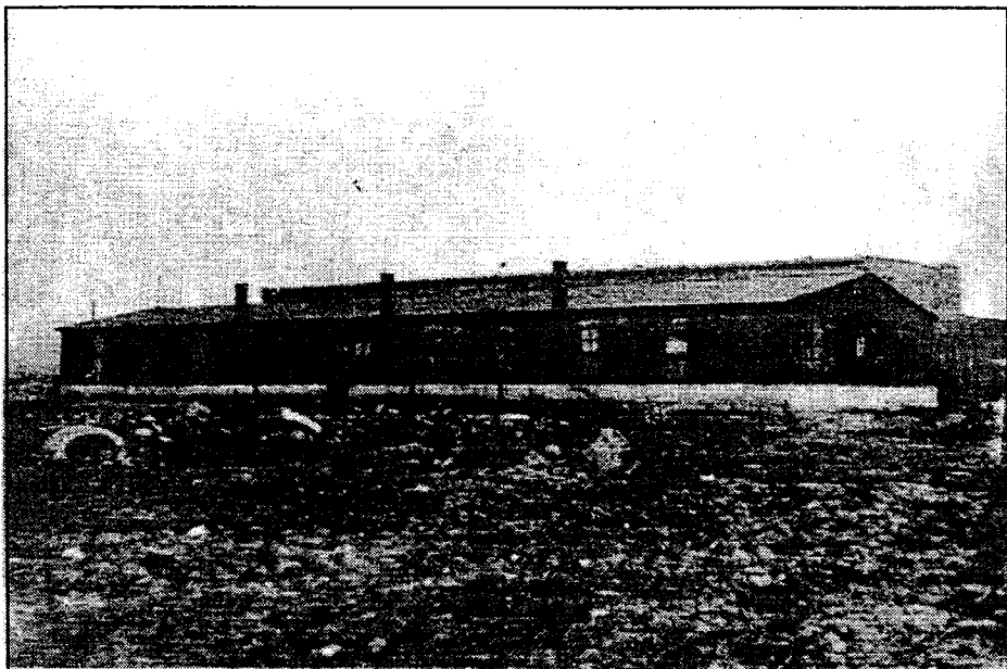
Табірний барак у Явожні. 1959 р.

Івано-Франківська обласна державна адміністрація Відділ у справах національностей та міграції Суспільно-культурне товариство «Лемківщина» Суспільно-культурне товариство «Надсяння»