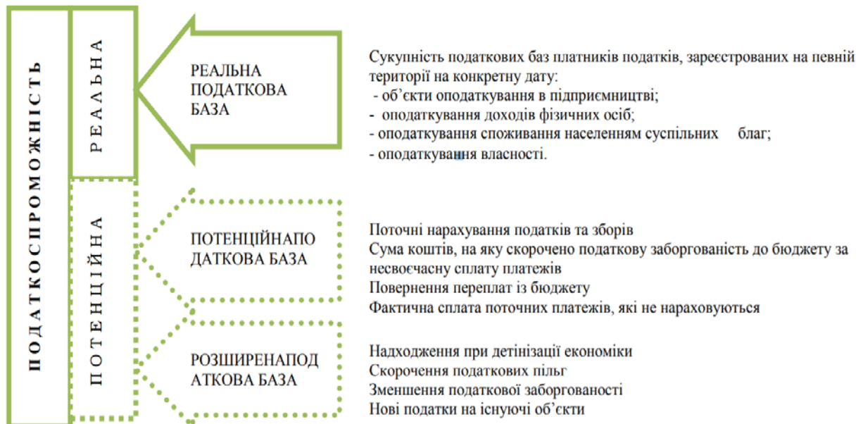
Рис. 1. Складові формування податкоспроможності територіальної громади [8]

Аналізуючи рис. 1, ми бачимо, що структура податкоспроможності регіону є досить розгалуженою та включає три основні складові: реальну податкову базу, потенційну та розширену. Остання може стати каталізатором економічного розвитку території та відновлення виробництва та підприємницької діяльності в межах відповідної адміністративно-територіальної одиниці.