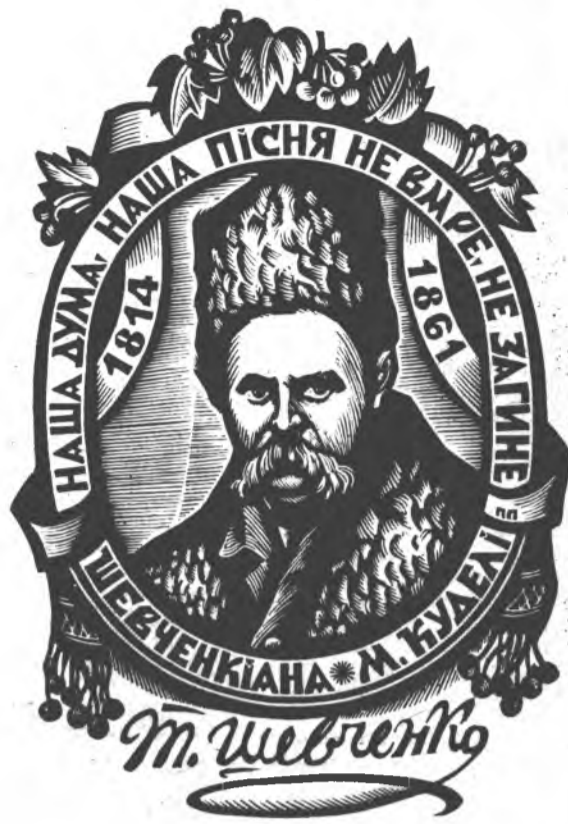
Ескібрис П. ПРОКОПІВА.

ДО 175-РІЧЧЯ З ДНЯ НАРОДЖЕННЯ Т. Г. ШЕВЧЕНКА