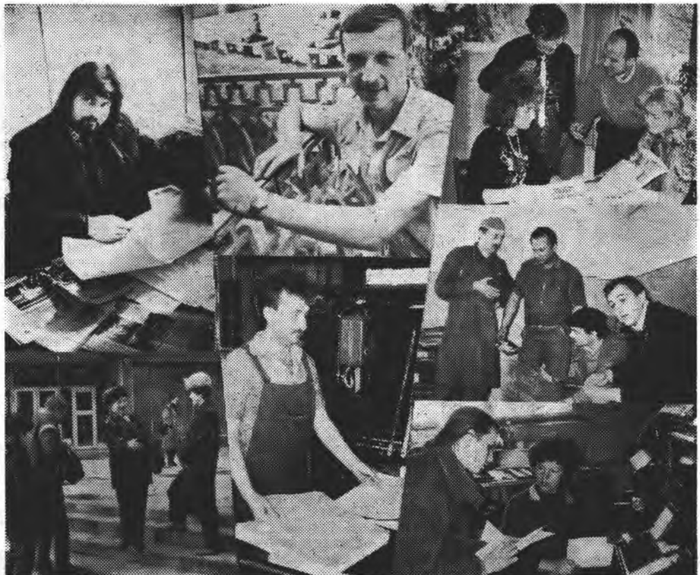
Фотомонтаж В. Боб'яка.

Щиро вітаємо всіх активістів газети та її читачів з Днем радянської преси. Бажаємо вам, друзі, нових творчих успіхів, гострого пера, натхнення і міцного здоров'я! Чекаємо ваших нових кореспонденцій.