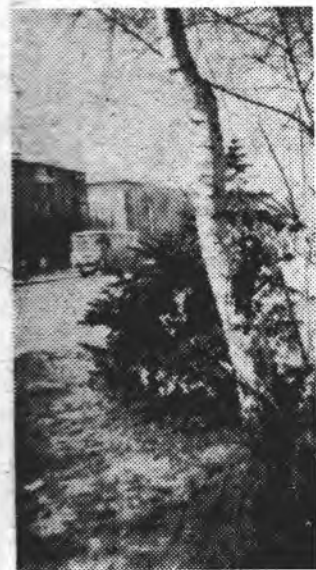
КУТОЧКИ РІДНОГО МІСТА.