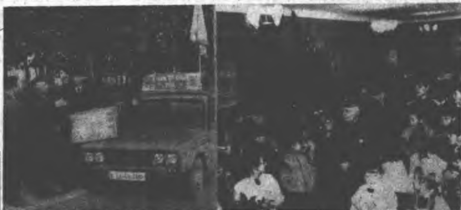
На знімках: зустрічі у Воронській середній школі.