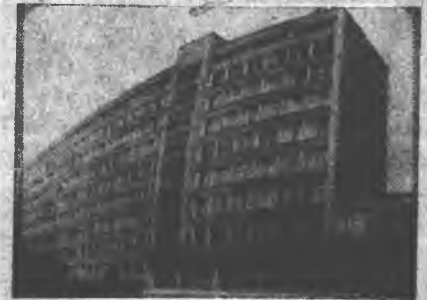
Газета Прикарпатського університету

9 грудня відбудеться повне місячне затемнення. 21 грудня Сонце вступить у зодіакальний знак Козерога. Початок зими.